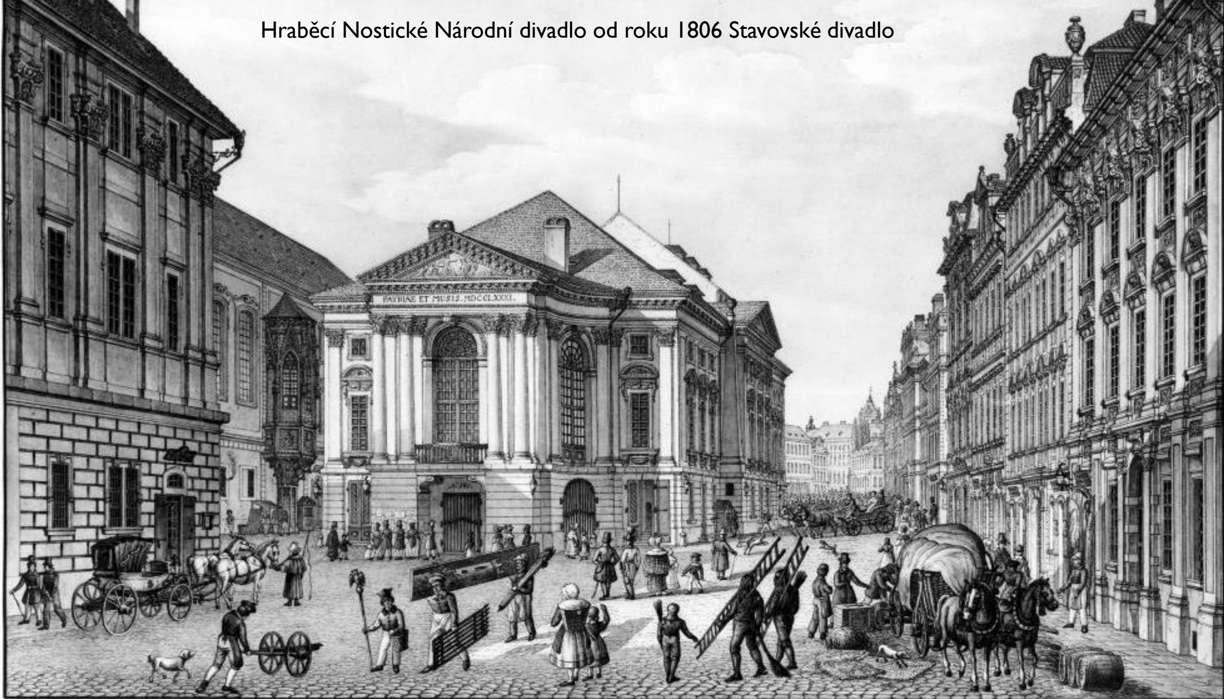
Hraběcí Nostické Národní divadlo od roku 1806 Stavovské divadlo