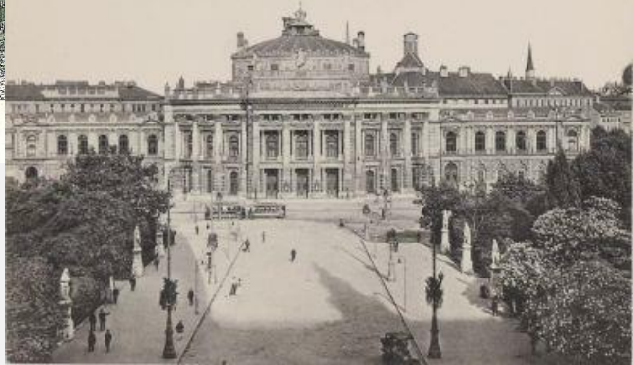
K. k. Hof-Burghtheater mit den Statuen historischer Persönlichkeiten Wien's. Wien I.