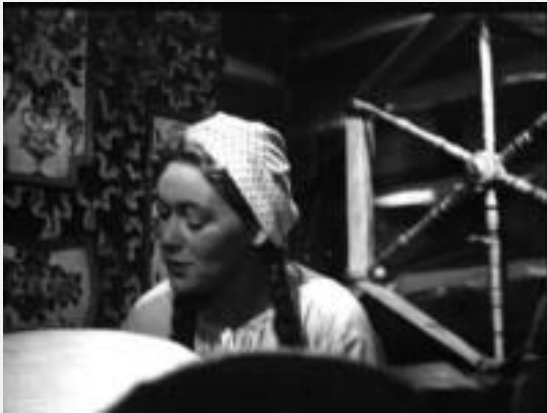
Divotvorný klobouk, muzikál, 1952, režie: Alfréd Radok