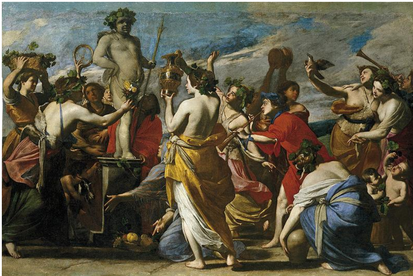
Massimo Stanzione; Sacrificio a Baco; olej na plátně, cca 1634.