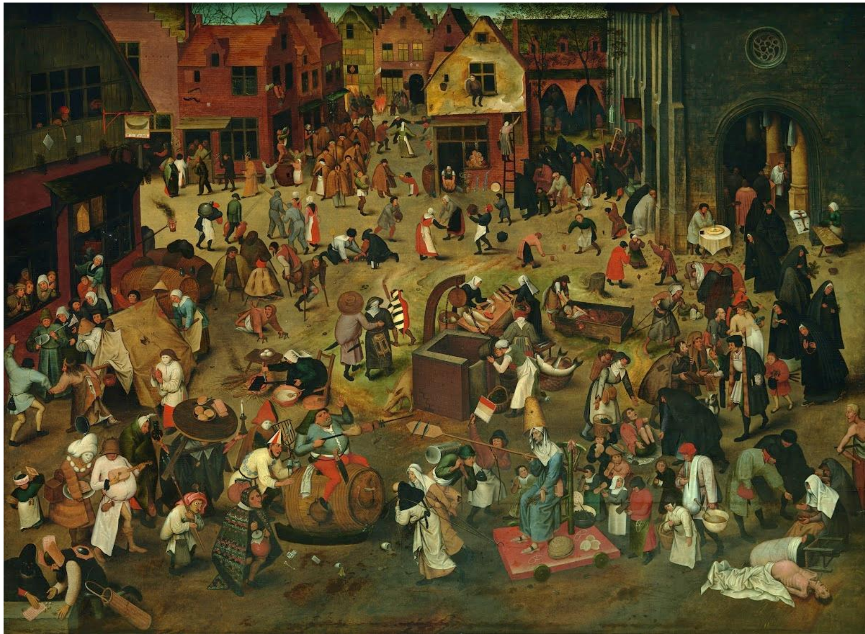
Pieter Bruegel the Elder; Strijd tussen Carnaval en Vasten; olej na panelu; 1559.