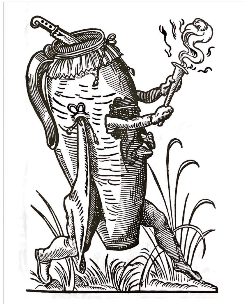
Groteskní dřevorez ze spisu Les songes de Pantagruel ( Pantagruelovy rozmarné sny ), vydaného v Paříži v roce 1565. Tradice připisuje jejich autorství F. Rabelaisovi.