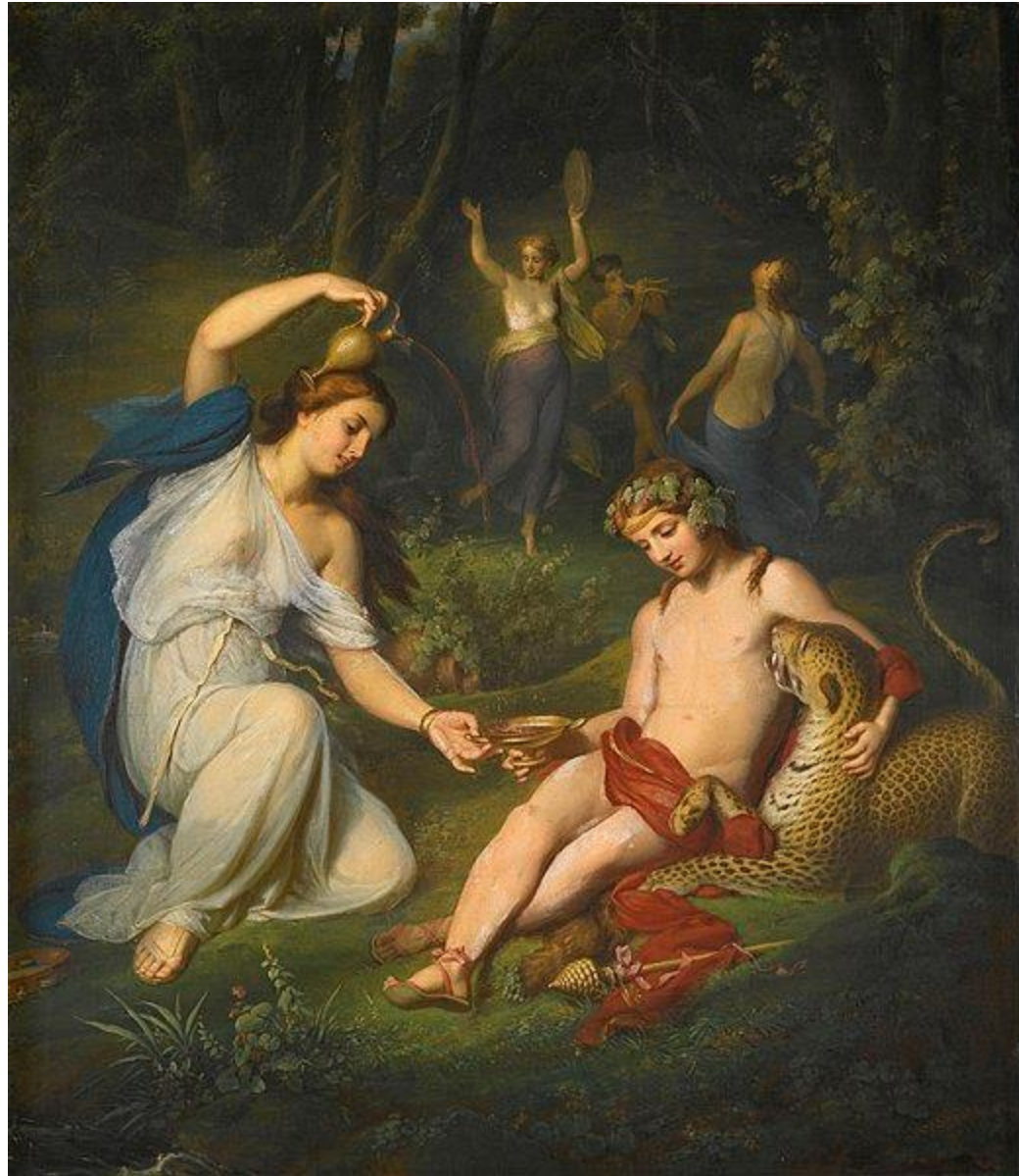
Johann Wilhelm Schütze; Bacchus with leopard/Bacchus, dem eine Nymphe Wein kredenzt; olej na plátně; před 1878.