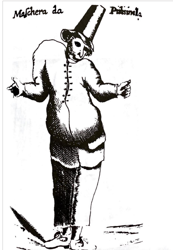
Pulcinella. Italský dřevořez z roku 1643, zpodobňující nejpoblárnější karnevalovou masku s charakteristickými groteskními atributy (velké břicho, hrb).