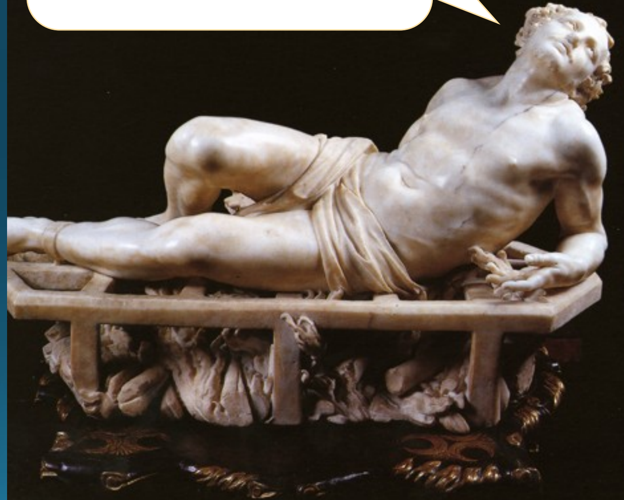
Sochár Gian Lorenzo Bernini (1598 – 1680)

„Táto strana je už pripravená, otoč ma na druhú!“