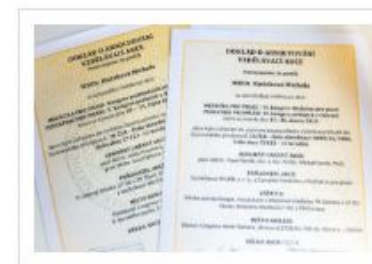
I v průběhu rodičovské dovolené se v oboru vzdělávám