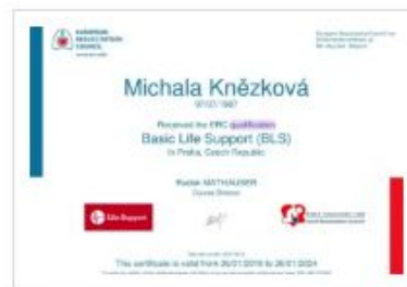
Mezinárodní certifikát resuscitace a práce s AED (defibrilátorem)