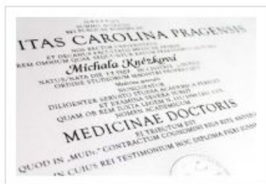
Ukončení studia na 1. lékařské fakultě UK