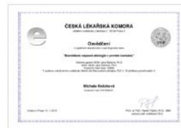
Zakončení kurzu Bezvědomí v prvním kontaktu