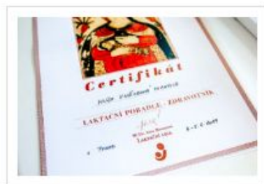
Certifikace Laktačního poradce Laktační ligy