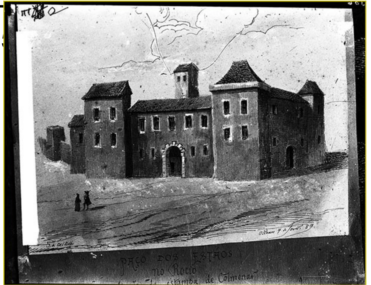
Figura 1 Paço dos Estaus no Rossio. Desenho à pena de Júlio de Castilho, decalcado da vista Olissipo de J. Braunio. AML, José Artur Leitão Bácia, PT/AMLSB/BAR/000908.