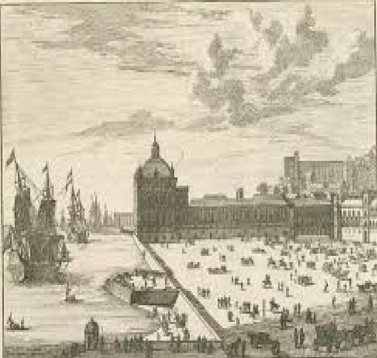
Vue de la place de Palais à LISBONNE.