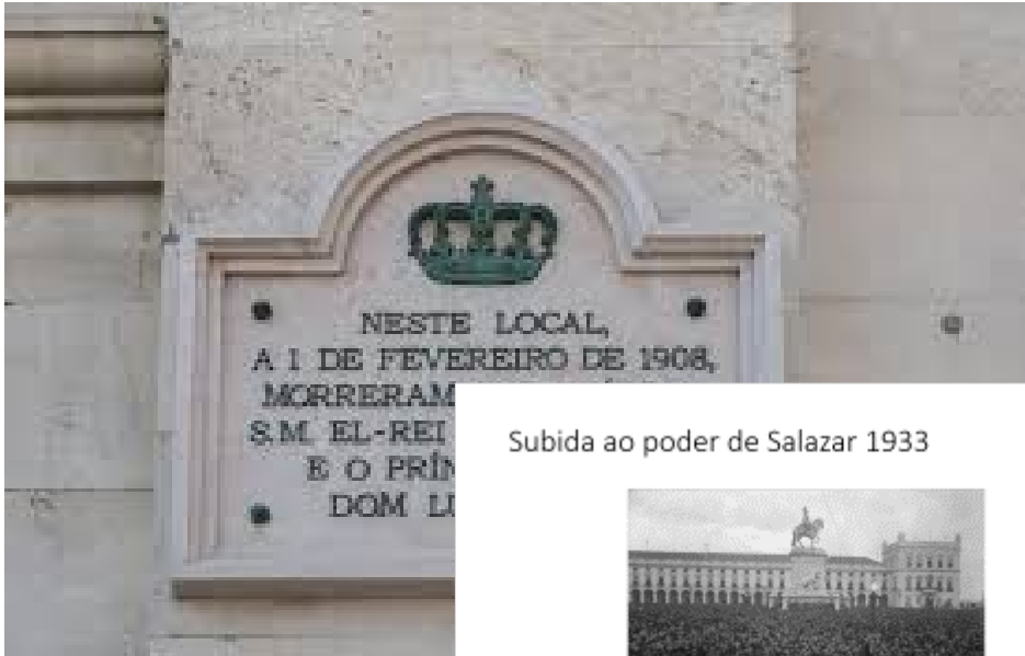
Subida ao poder de Salazar 1933