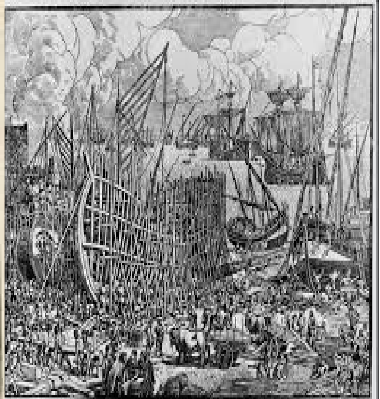
DESIGNED BY ROBERT DODD 1840