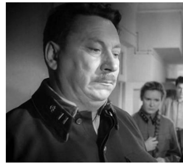
Vasilij Merkurjev — Fjodor Ivanovič