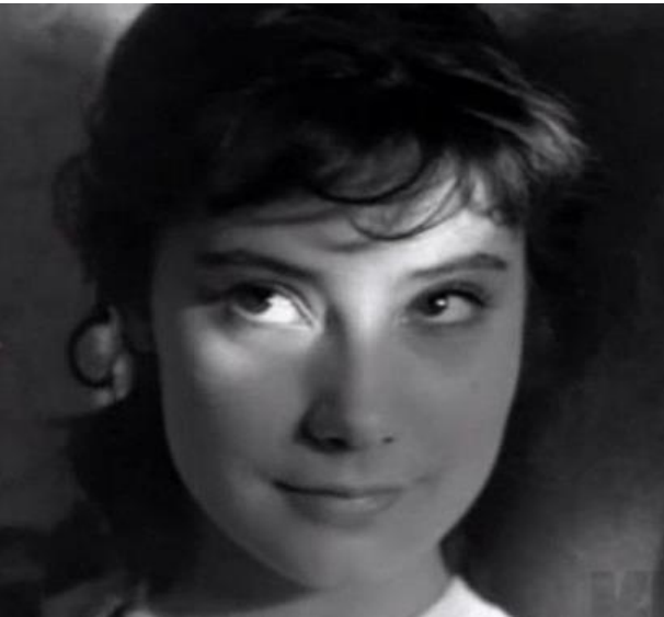
Tatjana Samojlovová — Veronika