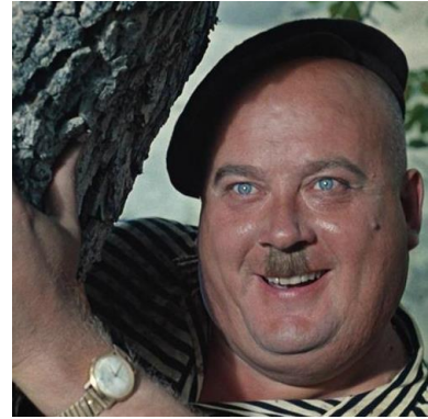
Jevgenij Morgunov , Ostřílený“. Sovětský úředník/šéf zločinné