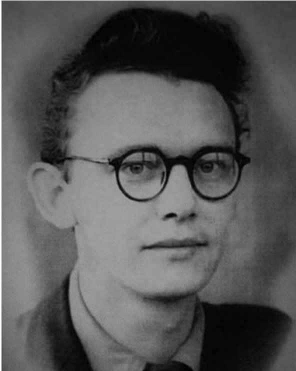
Zoščenko a Vladimir Majakovskij.

Leonid Gajdaj se narodil roku 1923 ve městě Svobodnyj. V 1900. léta otec byl vyhoštěn na Daleký Východ (byl účastník revoluční organizace). Po návratu pracoval na železnici v Amurské gubernii. Leonid byl mladším ze tří dětí. Brzy po narození Leonida se rodina přestěhovala do Čity a pak do Irkutsku, kde Leonid šel do školy.