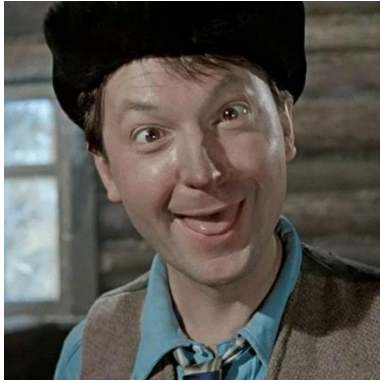
Georgij Vigin , „Zbabělec“. Tzv. „národní intelektuál“,