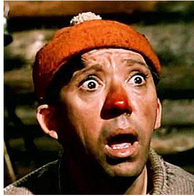
Jurij Nikulin , „Blbec“. Přihlouplý reprezentant „národa“.