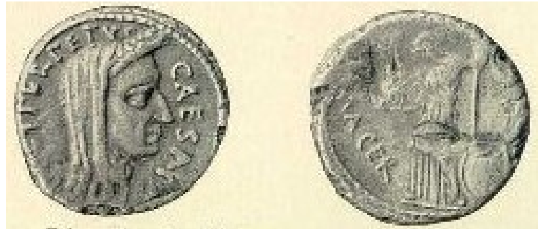
Římský denár, 45-44 př. n.l., Julius Gaius Ceasar jako pontifex maximus