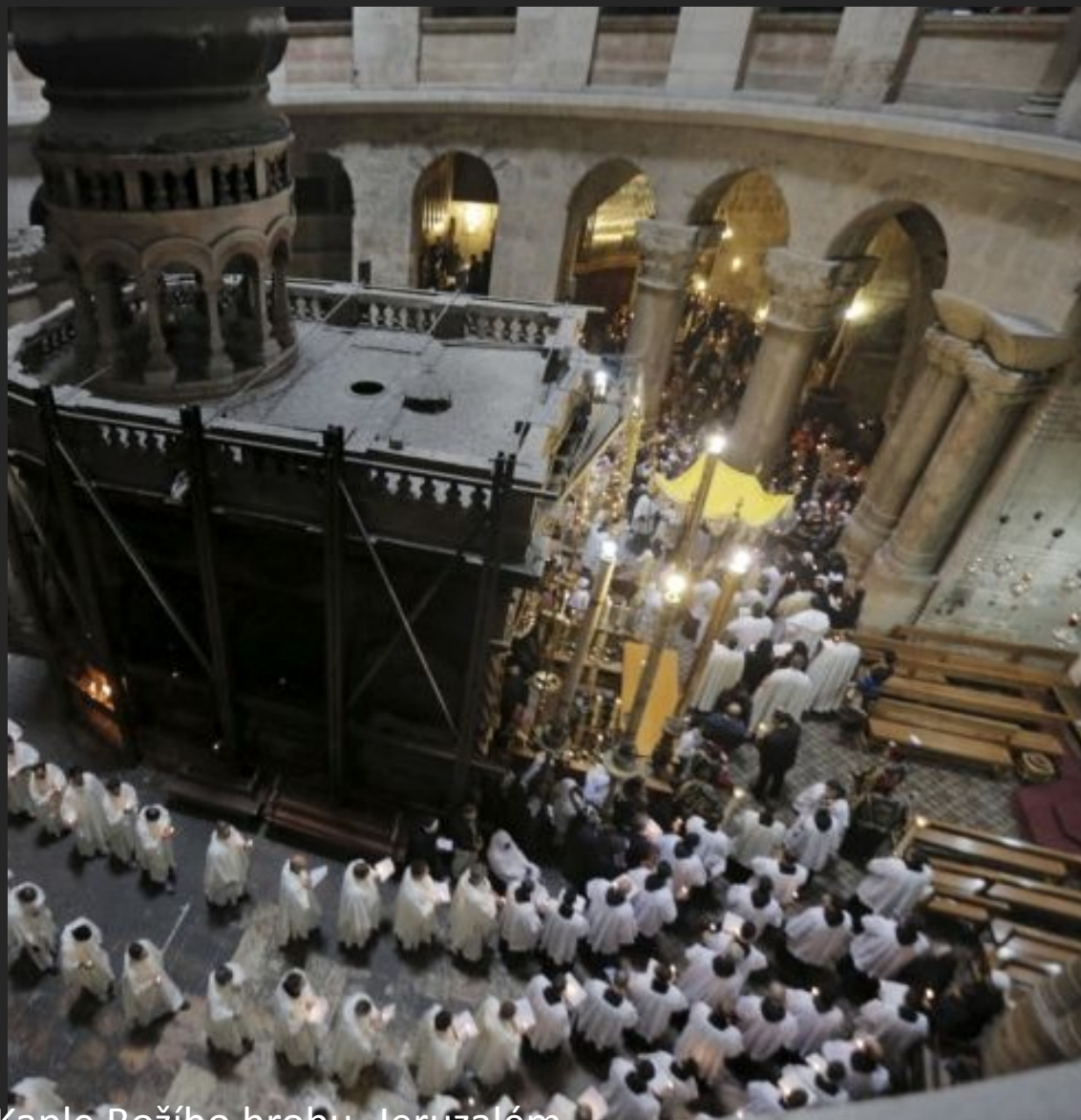
Kaple Božího hrobu, Jeruzalém