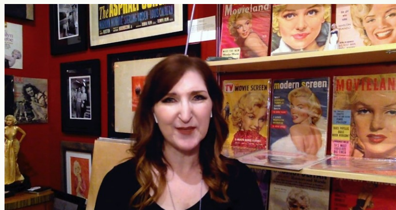
Rozhovory se sběrateli Pravděpodobně NE