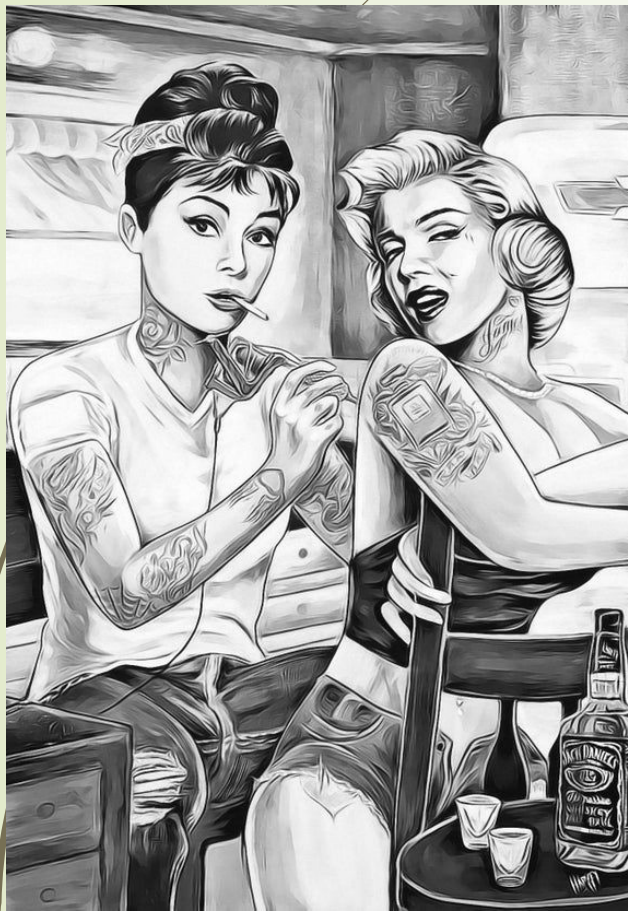
Campové reinterpretace ANO