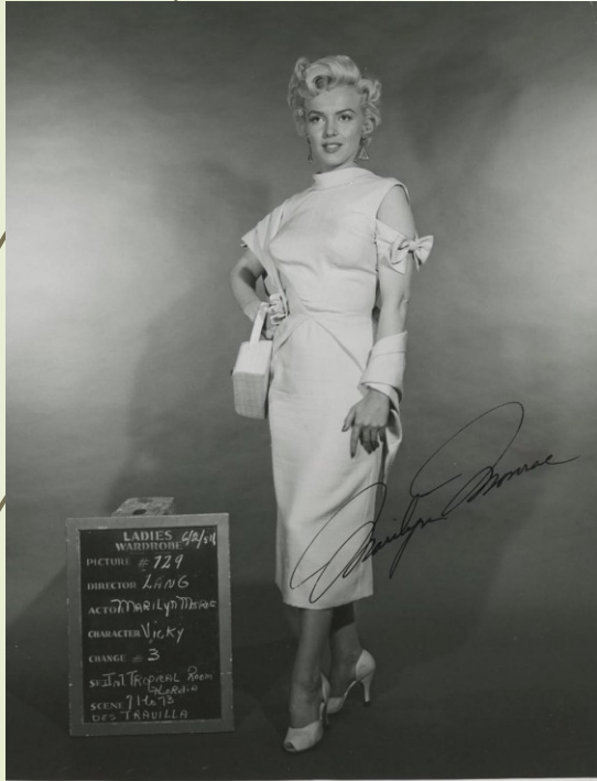
Podepsaná sběratelská fotografie NE