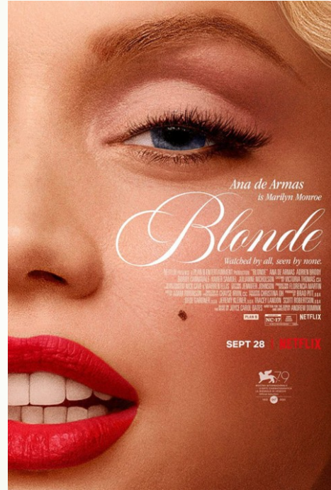
Blonde (r. Andrew Dominik, 2022) ANO