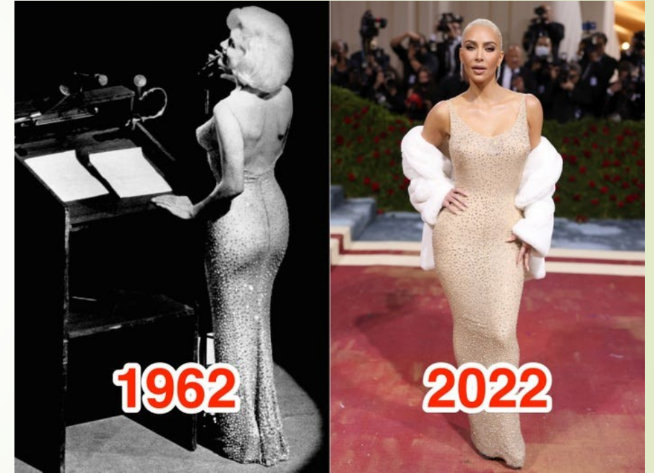
Šaty návrháře Jean Louise Jako reálný objekt: NE Jako kulturní dědictví: ANO