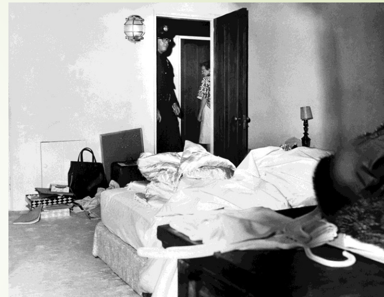
Fotografie z místa smrti NE