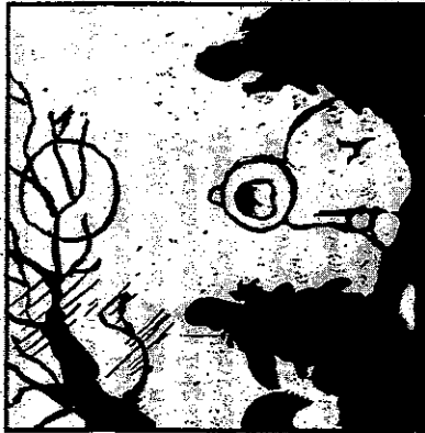
Er heult mit den Wölfen.