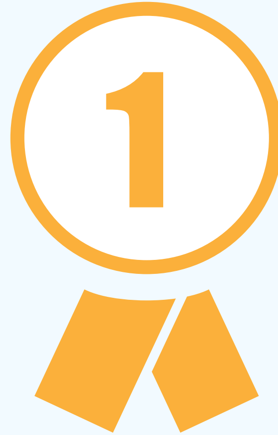
ПЕРШЕ ПРАВО ВИСЛОВИТИСЬ