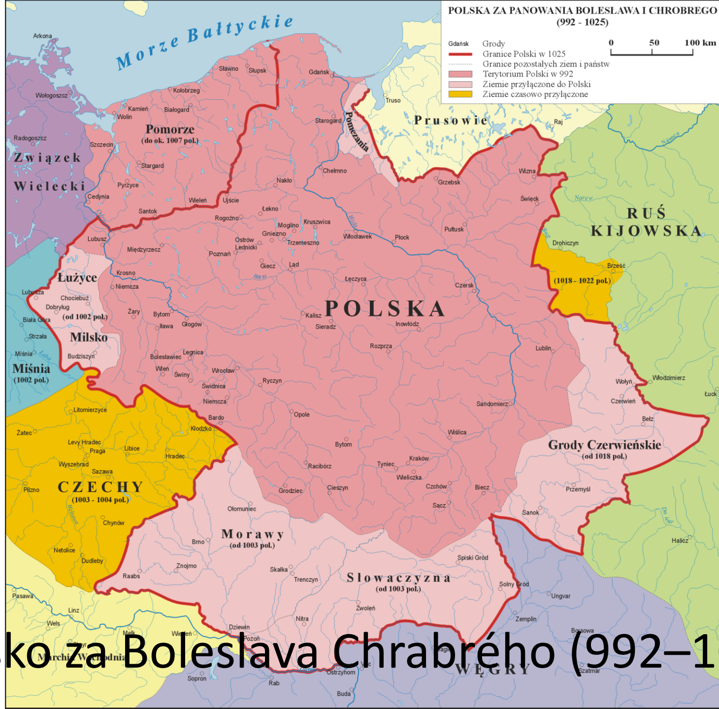
Polsko za Bolesława Chrobrego (992–1025)