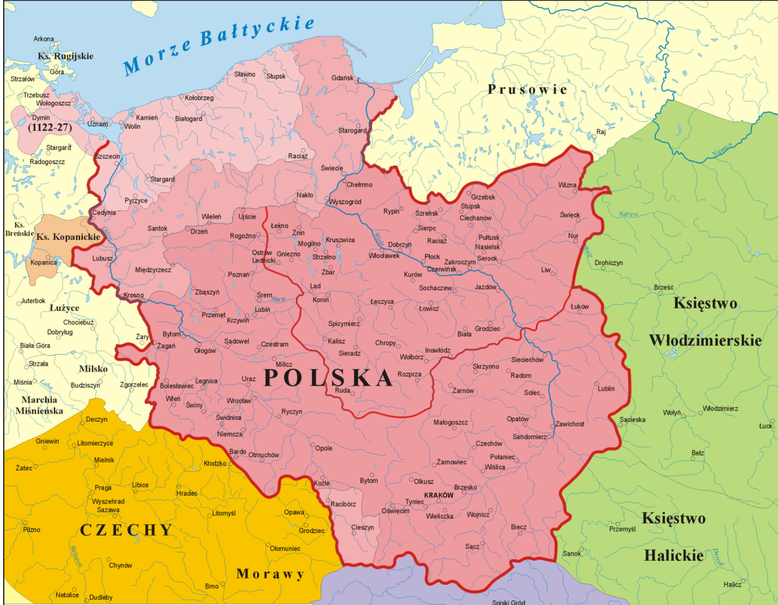
POLSKA ZA PANOWANIA BOLESŁAWA III KRZYWOUSTEGO (1102 - 1138)