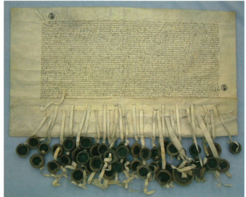
52. Dokument erekcyjny Związku Pruskiego