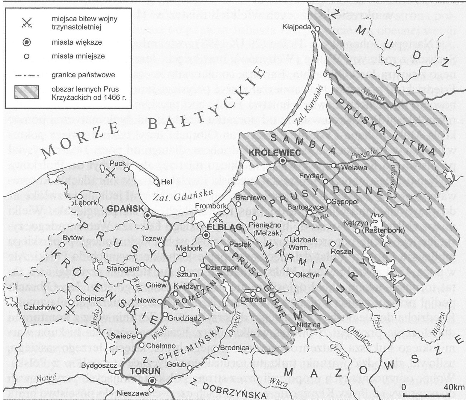
Mapa 14. Państwo zakonu krzyżackiego i Prusy Królewskie po 1466 r.