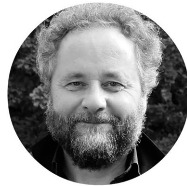
Bjørnar Olsen (*1958)

In Defense of Things: Archaeology and the Ontology of Objects (2010)