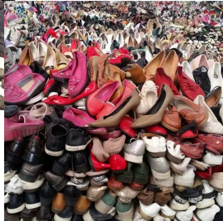
Sklad nenošených bot jako výsledek textilní nadprodukce