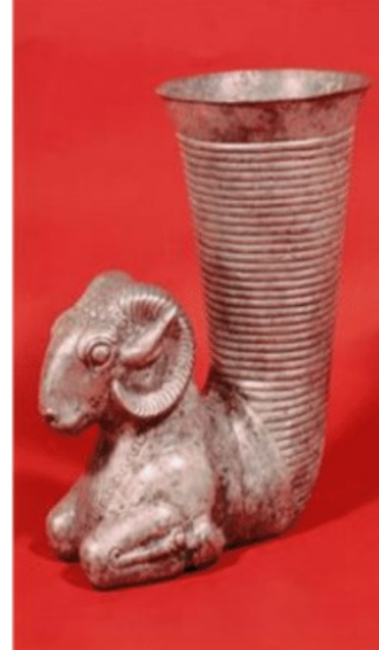
Stříbrný picí roh zdobený beranem (Mesopotámie)

Vykopávkový horizont – problém materiality