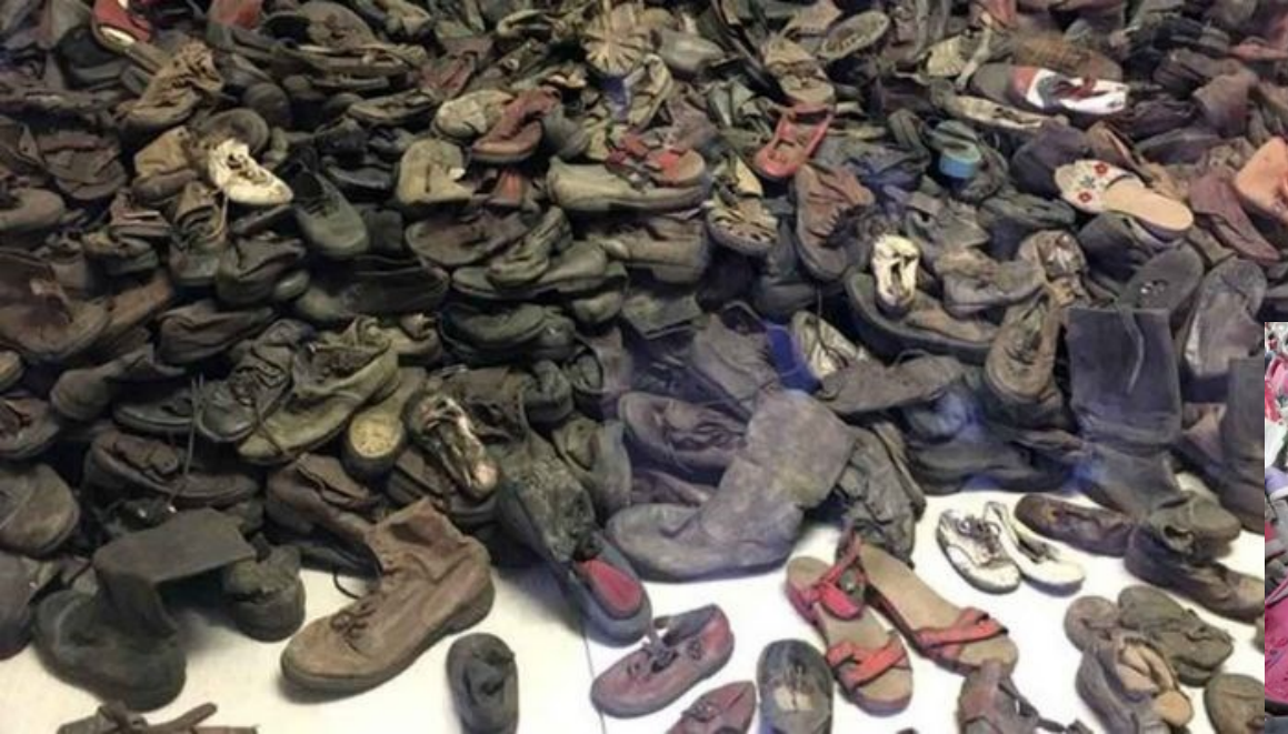
Boty obětí v koncentračním táboře (Osvětím)