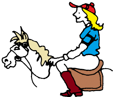
ездить вер хом