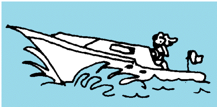
кататься на катере