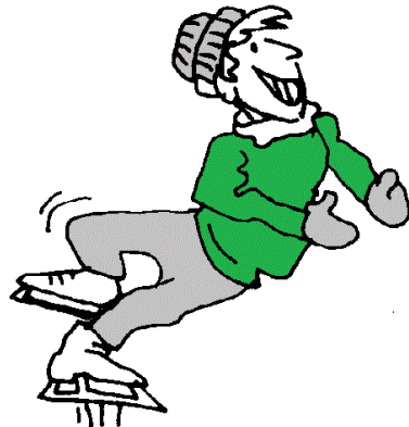
кататься на коньках