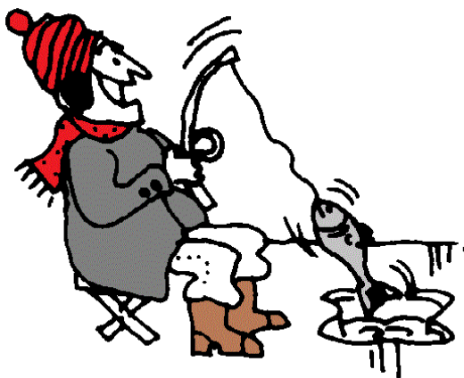
лов и ть ры бу