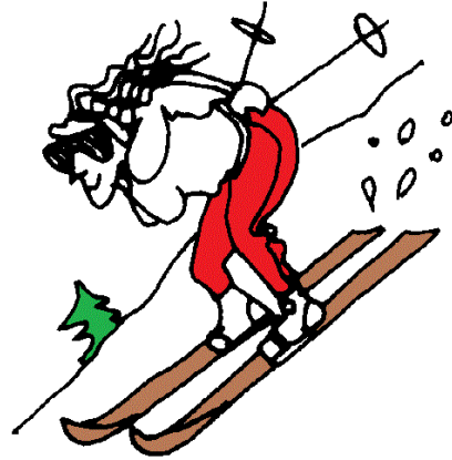
кататься на (горных) лыжах