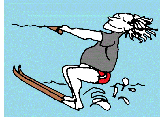
кататься на водных лыжах