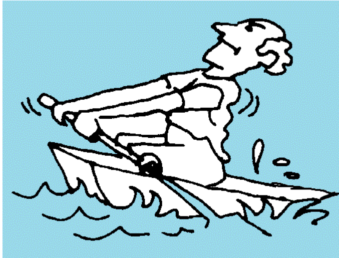
кататься на лодке