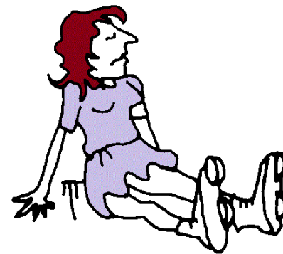
кататься на роликах