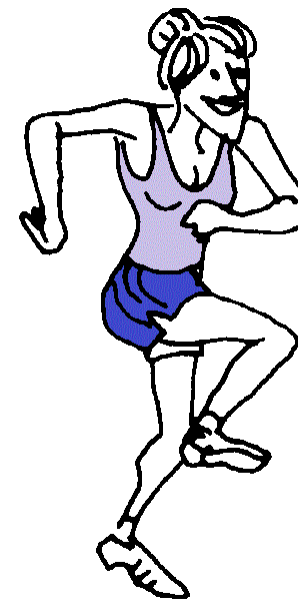
бе г ать