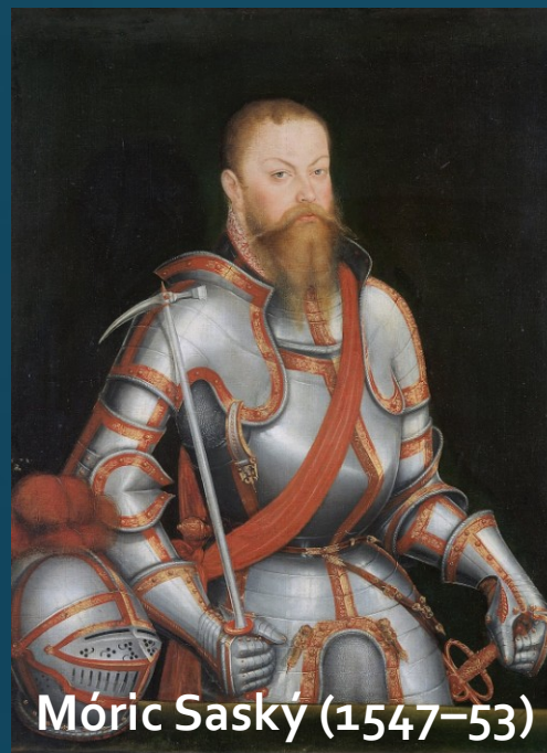
Móríc Saský (1547-53)