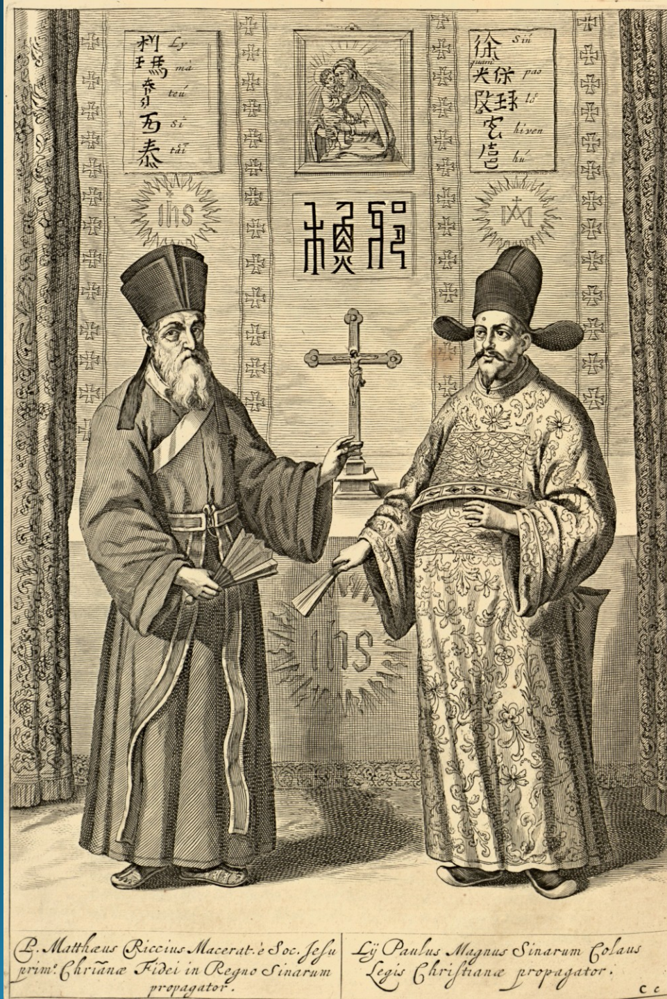
P. Mattheus Riccius Macerat. è Soc. Jesu prim. Christiane Fidei in Regno Sinarum propagator.