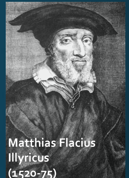
Matthias Flacius Illyricus (1520-75)