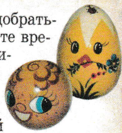
Неваляшки колобок и цыпленок

Но как бы то ни было са- мые-самые русские народ- ные куклы оказались вро- де бы и не совсем русскими, и не совсем народными, но все равно очень любимыми и у нас, и за рубежом. На- ша матрешка в 1900 году на Всемирной выставке в Париже получила брон- зовую медаль. И для многих она явля- ется символом России.