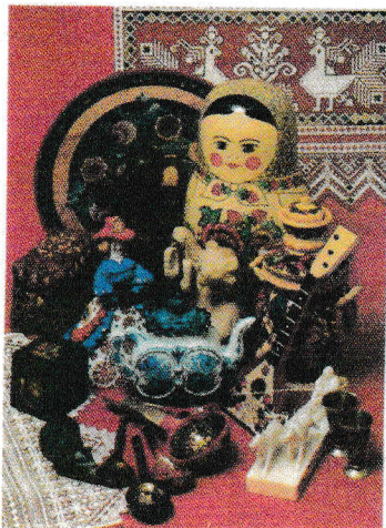
Изделия народных мастеров

Форма его действительно напоминает матрешку, а внутри находится пять фигурок, вложенных одна в другую. Это тоже япон- ские боги счастья, только помоложе и послабее. А от Дарумы, дескать, произо- шли русские неваляшки — они и вправду очень похо- жи. Только неувязка — не- валяшки родились в Рос- сии в начале XIX века, раньше, чем в моду вошло все япон- ское (конец XIX — начало XX века).