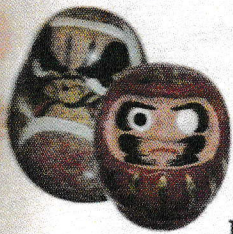
Японские куклы — Фукурума и Дарума

Рассказывают, что в конце V века в Индии жил-был один принц. Жил он, проживал, наслаждался роскошью и вдруг все бросил и ушел странствовать в горы Гималаи в поисках истины. Потом он поселился в Китае и стал очень знаменитым. Это был Бодхидхарма, двадцать восьмой патриарх буддизма и первый патриарх школы «дзен». Но при чем тут русские куклы? А вот при чем. В Китае и Японии много столетий делали и до сих пор делают куклу Даруму (так переименовали трудное индийское имя Бодхидхарма). Это что-то вроде неваляшки (потому что Дарума, согласно легенде, девять лет сидел без движения, размышляя о вечном, и фигура его стала грузной, как колода). В конце XIX века такие куклы в числе других восточных диковинок