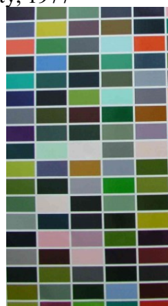
1024 barev, 1973