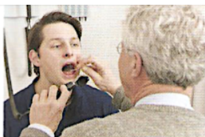
У нього ангіна.