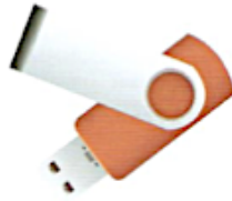
флеш карта флешка