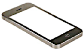
мобільний телефон смартфон