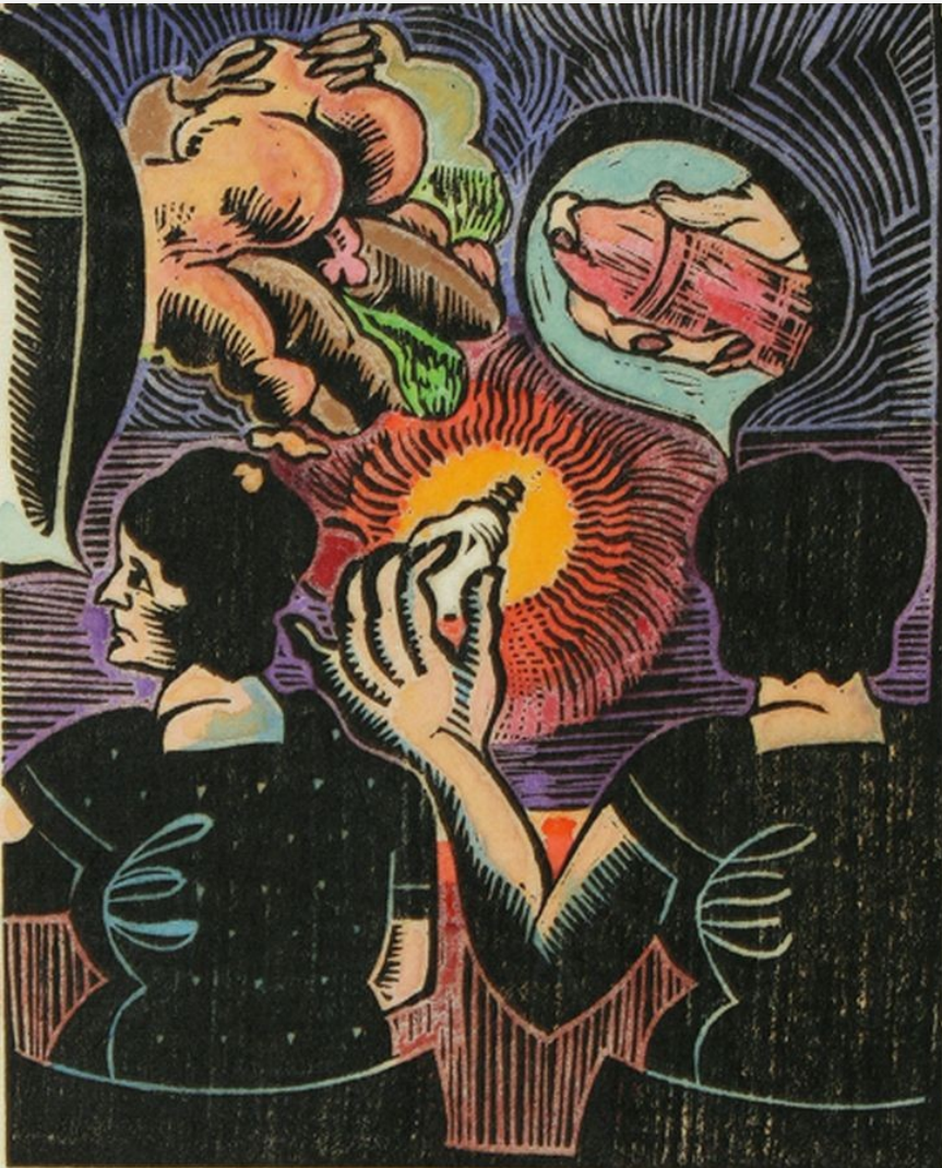
Auguste Kronheim, Series – Bright as bright day (series), 1970s.