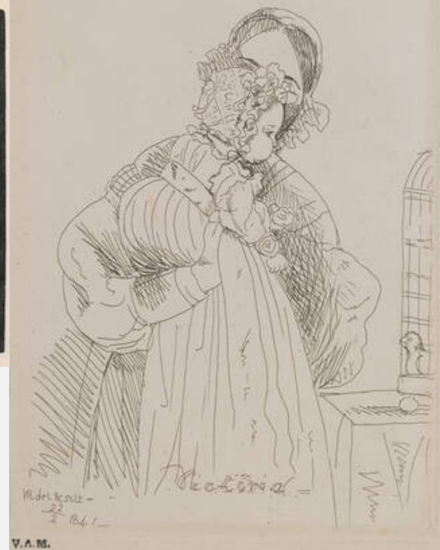
Print depicting Princess Victoria, by Victoria, Queen of Great Britain, 1841, England.