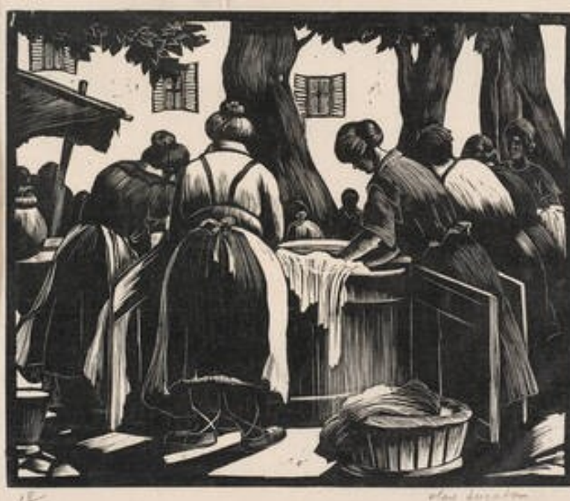
Toulon Washerwomen, wood engraving, by Clare Leighton, about 1920s, Britain.