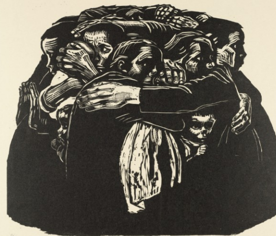
Käthe Kollwitz. The Mothers (Die Mütter) from War (Krieg) . 1921-22, published 1923.