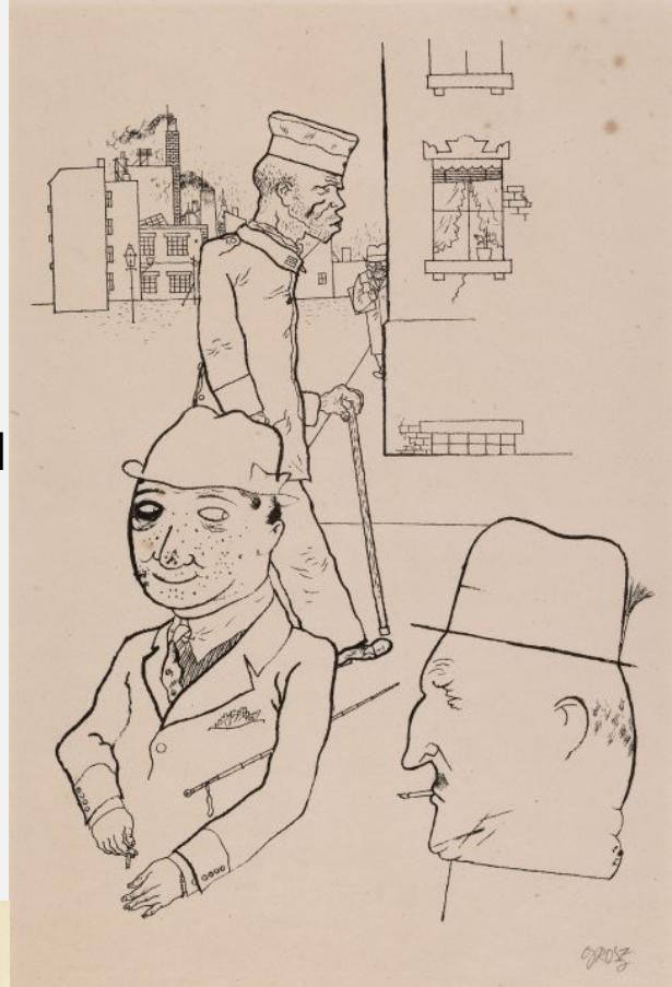
George Grosz, Bright Eyes , 1922-1924