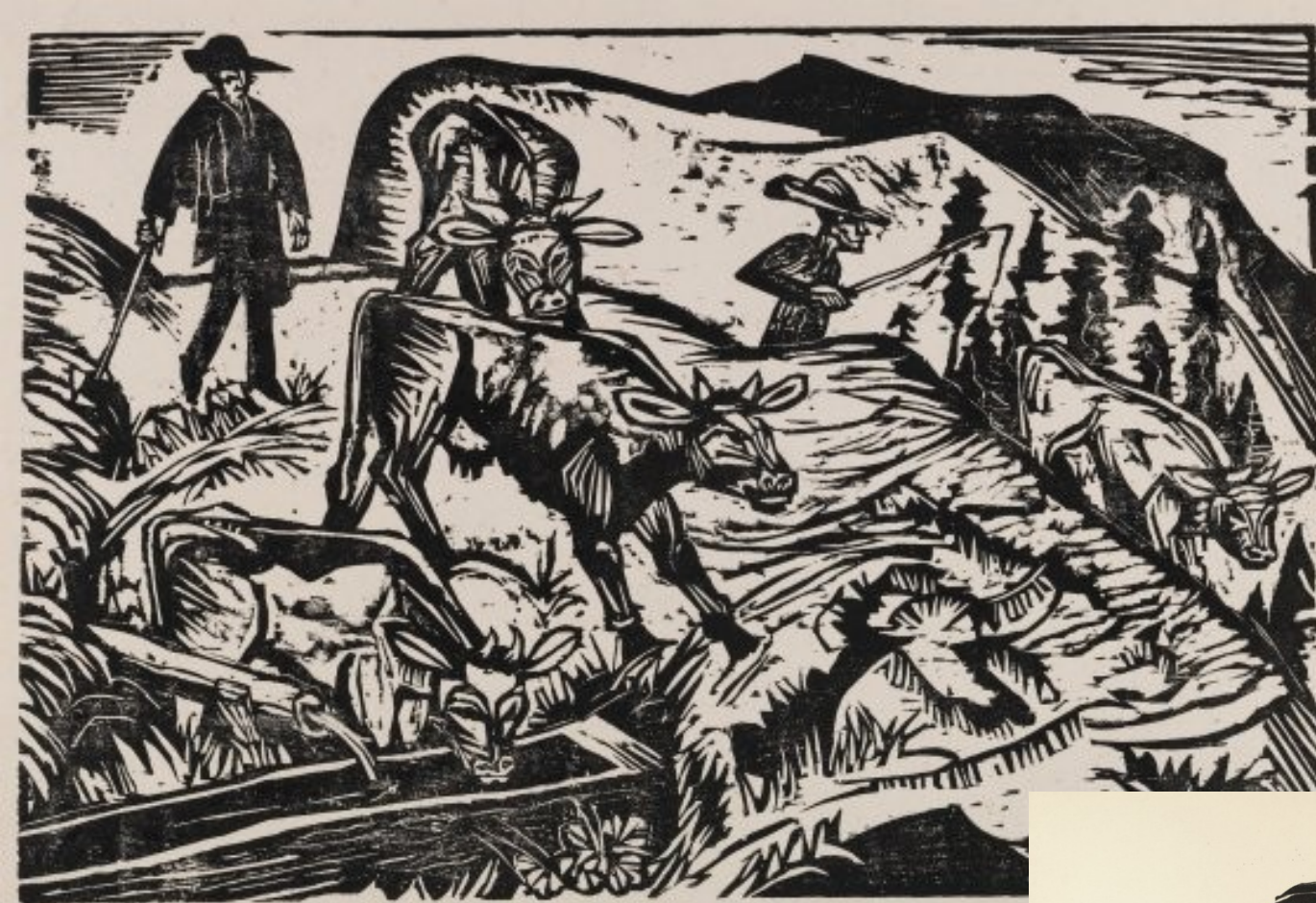
Ernst Ludwig Kirchner (German, 1880-1938). Cows Descending , 1917. Woodcut.