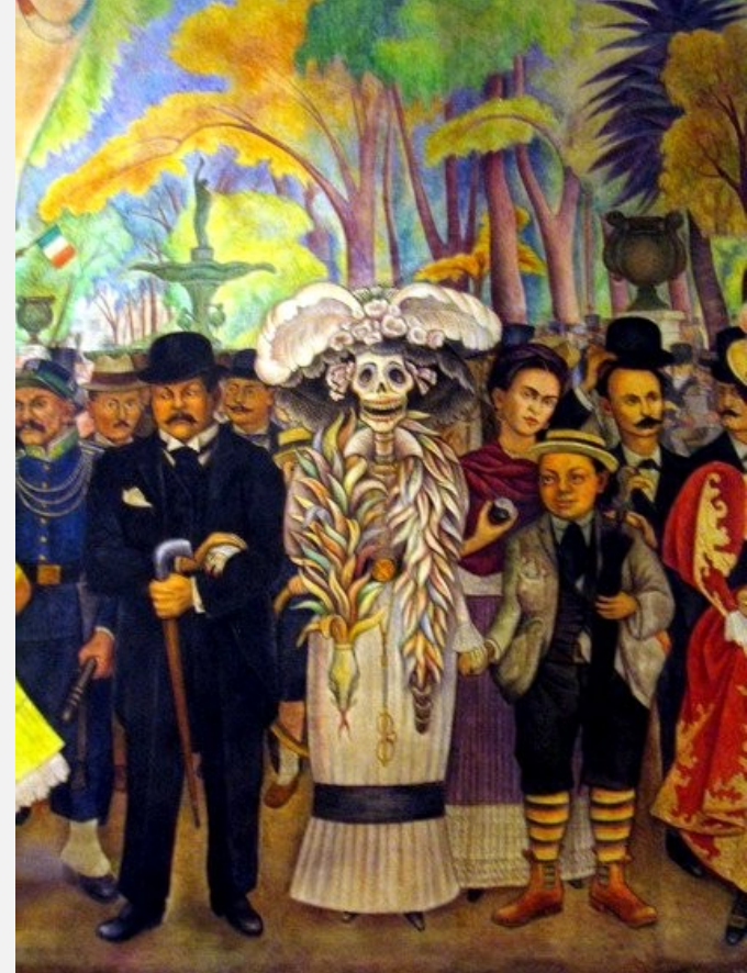
Diego Rivera, Sunday Afternoon in Alameda Park (mural) (1946–1947)