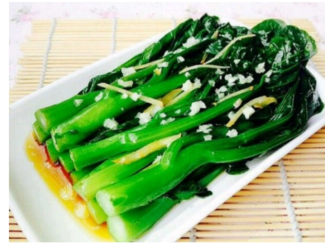
菜心 coi3 sam1