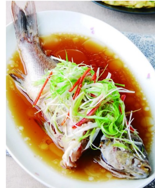
清蒸魚 Cing zing1 jyu1