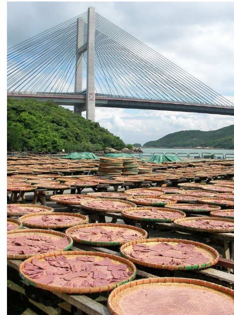
蝦醬 haa1 zoeng3