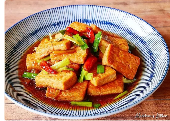
紅燒豆腐 Hung4 siu1 dau6 fu6

白灼 baak6 coek3 blanching, cooking with clean broth