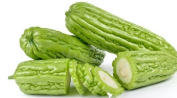
涼瓜 / 苦瓜 loeng4 gwaa1/fu2 gwaa1