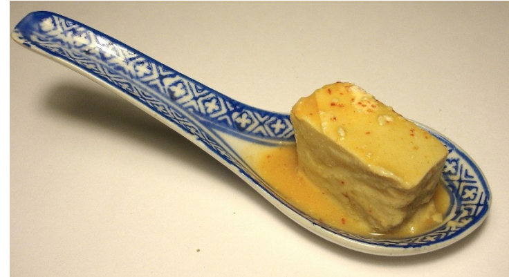
腐乳 fu6 jyu5