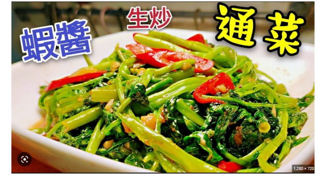
通菜 tung1 coi3