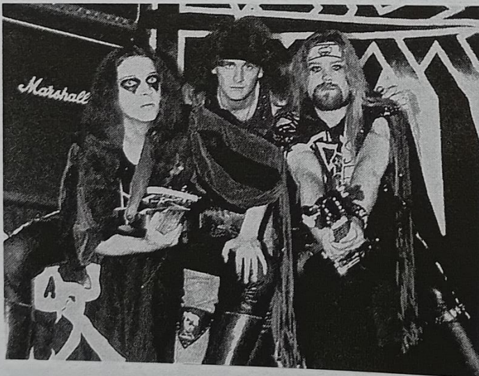
Inkvizitor, horší než mor (Törr, Klavdivo na čarodějnice)

O koncertu objevu roku 1988 referoval s barvitými odkazy na dobový oficiální bezpečnostní termín „propagace fašismu a kultu násilí“ ve svém, dnes už v metalové subkultuře legendárním článku Ladislav Urban (Urban, 1988). Bez zajímavosti není ani fakt, že blackmetalový Törr, který se v anketě čtenářů MS umístil třetí, následovali v anketě jako osmí punkoví HNF, o nichž byla v tomto článku řeč v souvislosti s odtažitým vztahem k metalu a přinejmenším nejasným vztahem k rasistickým skinheads (žebříček viz MS 1989, 18, s. 31). Relativně hojný výskyt inklinací k fašismu mezi mládeží konstatovala jedna z agenturních zpráv: „Z analýzy vyplývá, že od roku 1981 [do začátku roku 1987] byl na celém území zaznamenán výskyt 1 363 případů profašistických projevů“ (Analýza, s. 1).