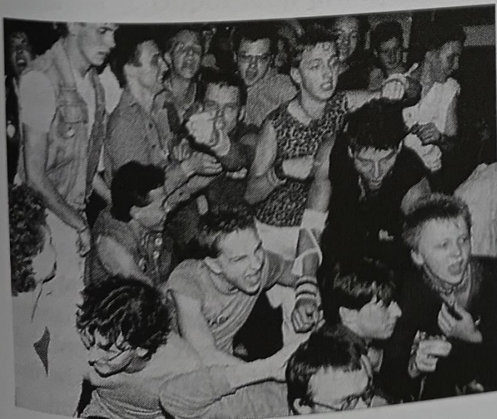
„Punk a pogo, to je v nás, kultura, co nemá řád. Ježek, číro na hlavě, kožený bundy“ (HNF, Punk a pogo)

Obecněji bylo násilí mládeže u řady autorů chápáno jako složitý fenomén, u něhož „neobstojí argumenty typu násilníci pocházejí z rozvrácených rodin“ (Chuchma, 1987b). Josef Chuchma dále psal o „přesyceném prostředí velkoměst“ způsobujícím permanentní stres, podrážděnost a frustraci, o nezdravém morálním klimatu v ČSSR, autoritativní výchově v rodinách, krizi školství, jeho přílišné feminizaci a nedostatku životní perspektivy u mladých (týž). Miloslav