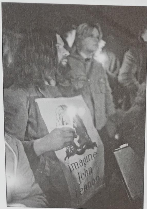
Setkání příznivců Johna Lennona na Kampě, 1986.

Akce „Lennon“ byla v chronologické řadě poslední akcí zaměřenou na mládež a problematiku hudby. Charakteristická byla rovněž svým zaměřením na Prahu a Středočeský kraj, resp. na pražskou Kampu a tzv. zeď nářků a její okolí, a také svým načasováním – vždy několik dnů, týdnů před a po výročí zastřelení Johna Lennona (8. 12. 1980). Nejprve neorganizovaná shromáždění byla veřejnou bezpečností monitorována již od svého vzniku v roce 1980, resp. 1981. Tím, jak shromáždění nejen početně, ale především myšlenkově narůstala, vyslovovala se k otázkám míru, odzbrojení, vojenské základní služby, začala být podnětná i pro StB. Odvetná akce režimu dostala název „Lennon“.