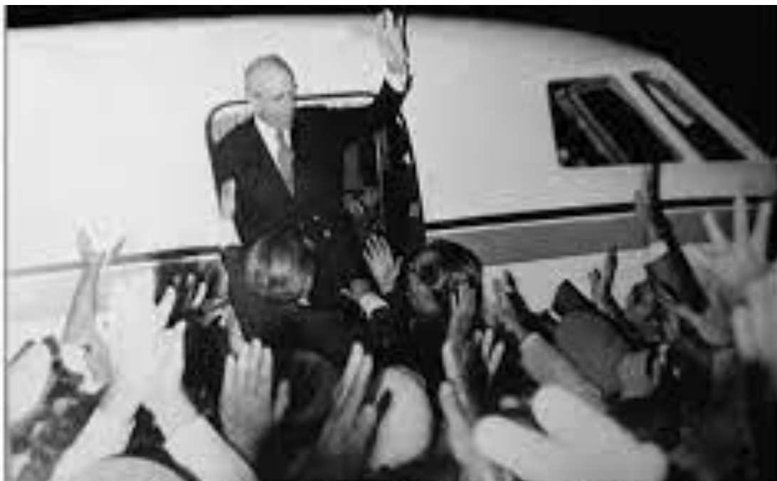
Ο Κωνσταντίνος Καραμανλής αφιγήθη στο αεροδρόμιο του Ελληνικού στις 2 το πρωί της 24ης Ιουλίου κι έγινε δεκτός από ένα τεράστιο