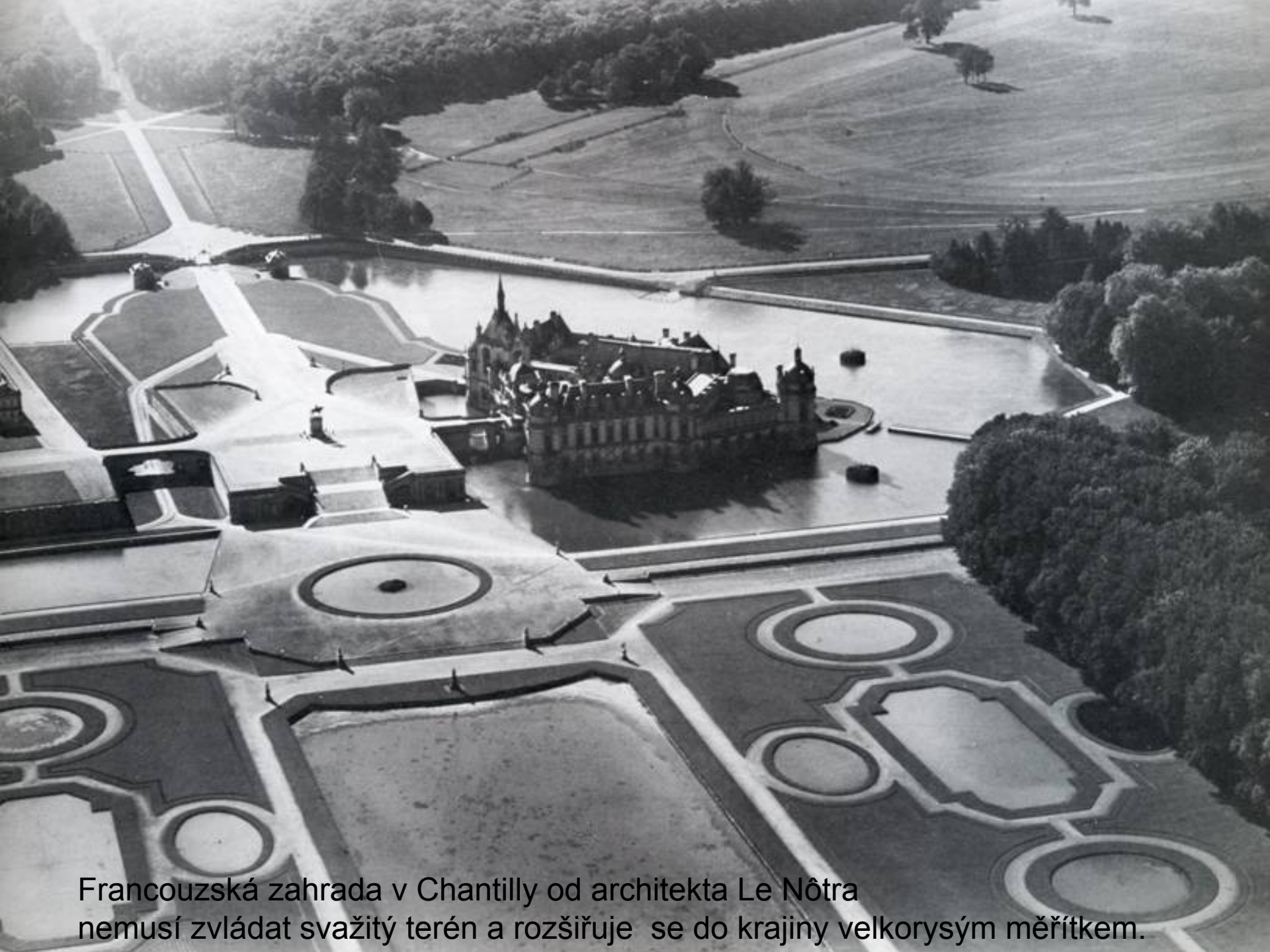
Francouzská zahrada v Chantilly od architekta Le Nôtra nemusí zvládat svažité terén a rozšiřuje se do krajiny velkorysým měřítkem.