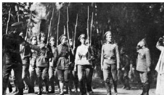
Ruské ženy odvedené do armády na vojenské přehlídce. Jedná se o členky ženského praporu smrti.