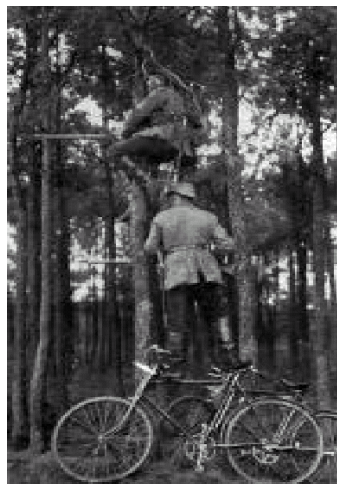
Němečtí průzkumníci na bicyklech, hlídkující na stromech