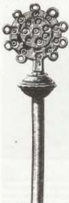
Obr. 33 Bronzový násadec na hláv označovaný jako žezlo. Průměr kruhu je 6,1 cm