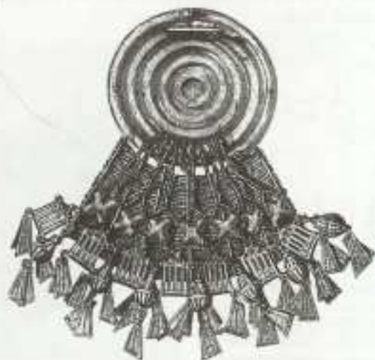
Obr. 34 Slavný Wanklův bederní závěs, jehož obraz je snad v každé větší knize o archeologii českých zemí. Dnes je chápán jako dva odlišné předměty, které se shodou okolností dostaly na nalezišti k sobě. Je to jednak kruhový prsní pancíř, který chránil srdeční krajinu bojovníka, jednak souprava závěsků tvořící nejspíš koňskou ozdobu