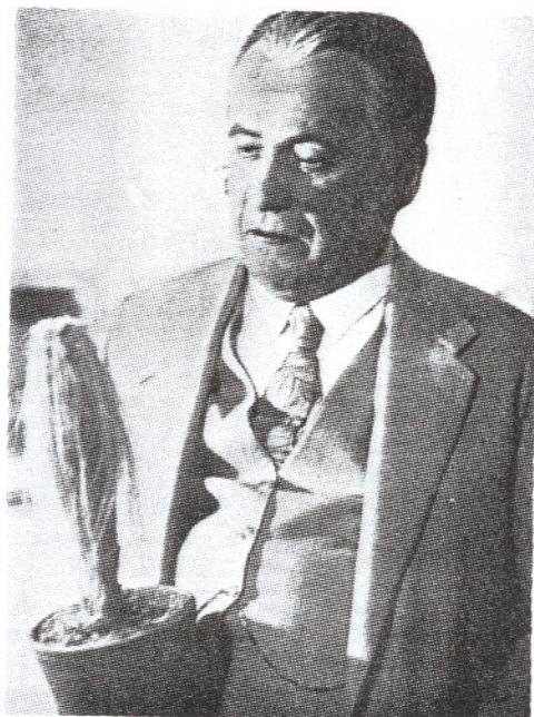
V inscenaci Mahenovy hry O maminku (Zemské divadlo v Brně, 1932)