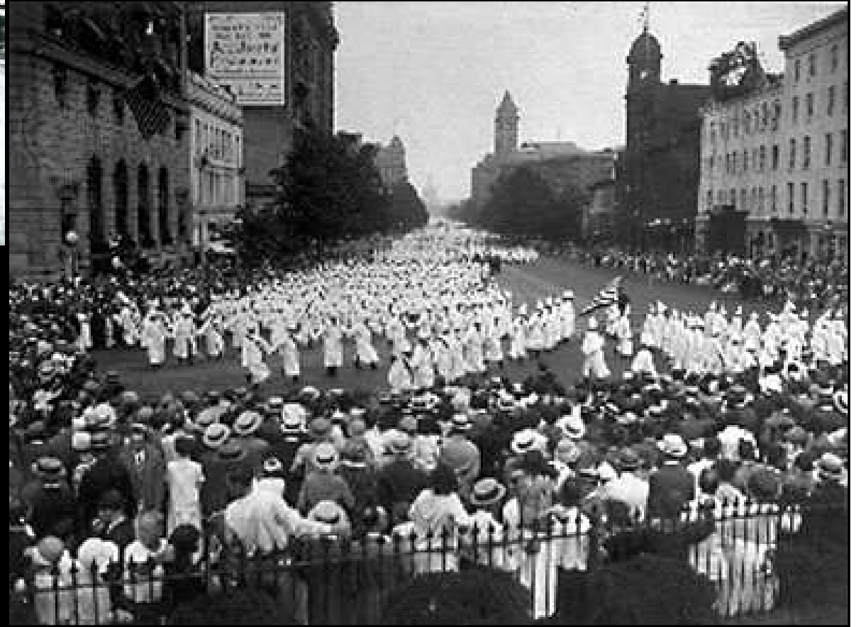
vpravo: průvod Ku-Klux Klanu na Times Square při premiéře filmu 3. března 1915