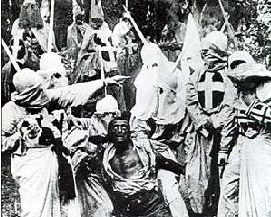
vlevo: scéna lynčování černošské postavy Guse ze Zrození národa