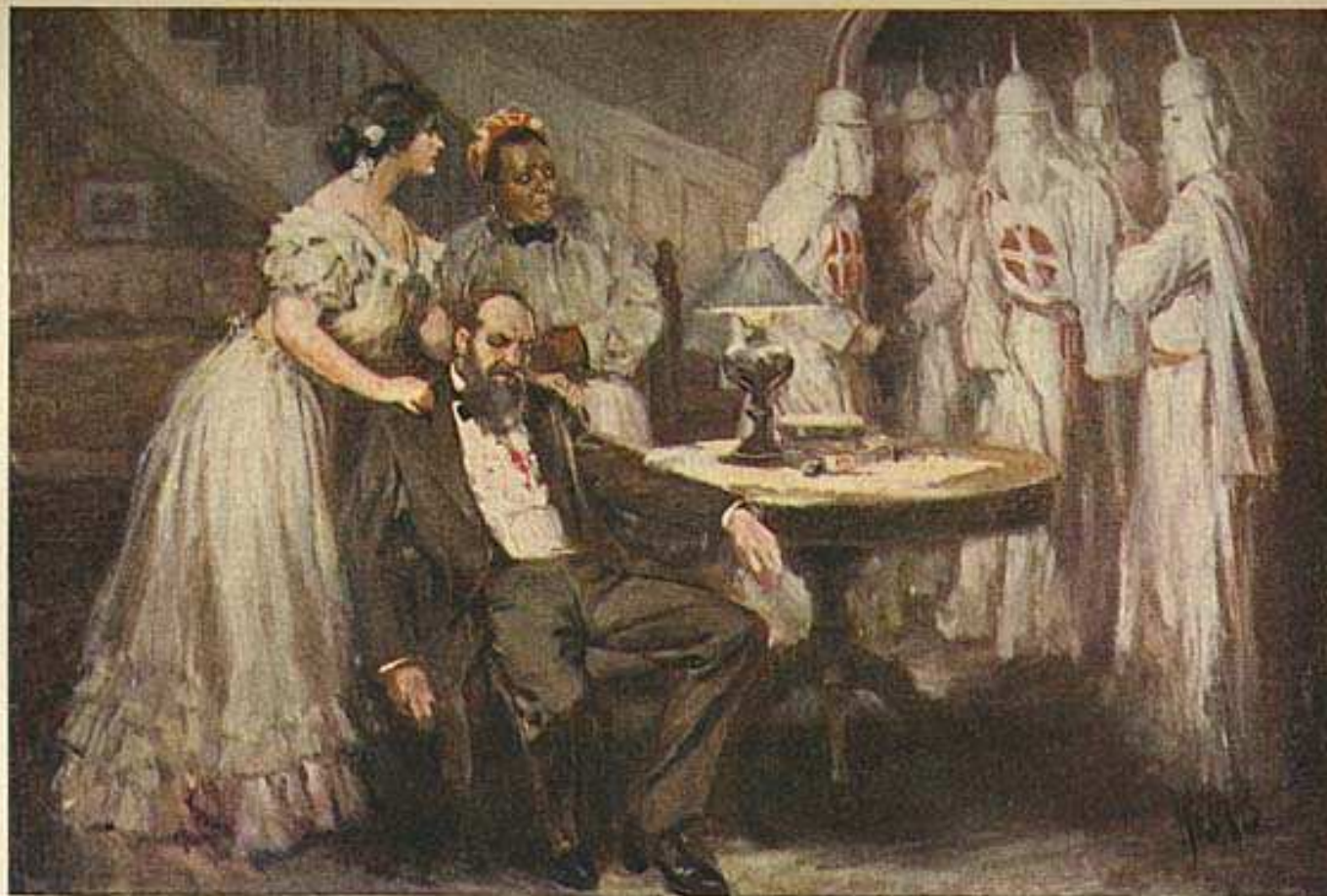
"Stella stared at the lifeless form"