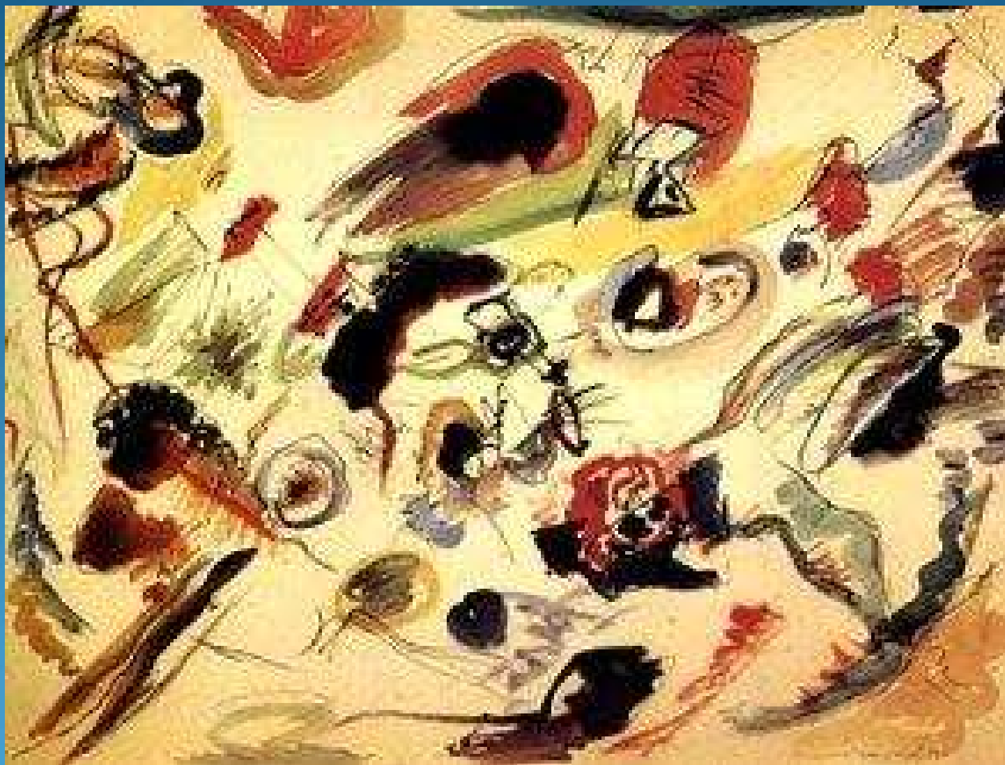
Vassilij Kandinskij, Primo acquerello astratto, 1910