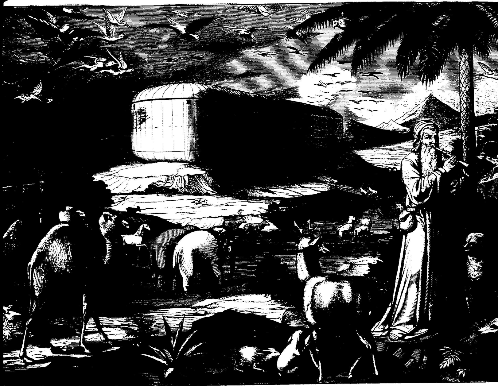
Die Arche Noe's.