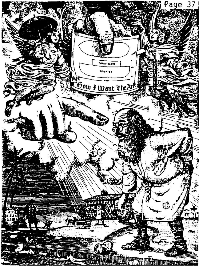
"You want me to build a boat?" Noah asked.