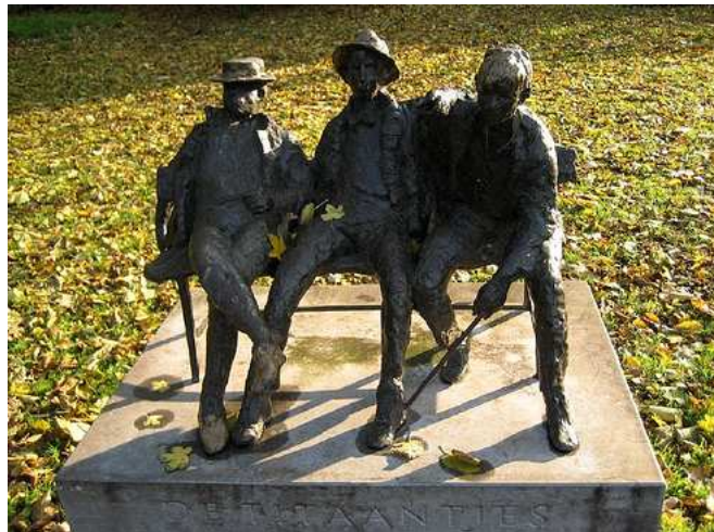
Standbeeld van drie “Titaantjes” door Hans Bayens in het Oosterpark in Amsterdam