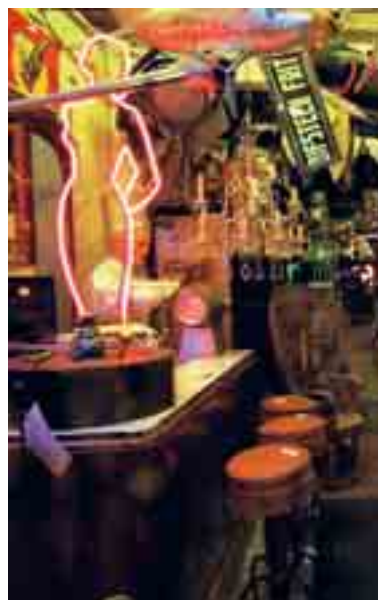
Vitrine in de Kloosterstraat.