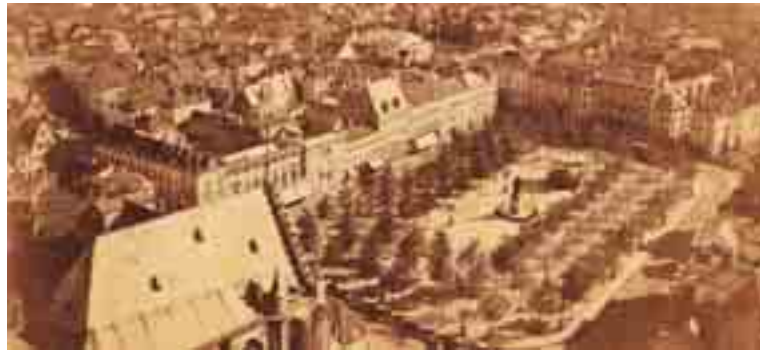
Groenplaats, vóór 1890.

Elsschot is onlosmakelijk verbonden met de Scheldestad. Met de wandeling 'Op stap met Elsschot' ontdek je plekken die een belangrijke rol hebben gespeeld in het leven en werk van de auteur, aangevuld met locaties waar je vandaag in Antwerpen Elsschot terugvindt.