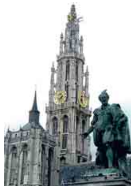
OLVrouwekathedraal en Rubens.