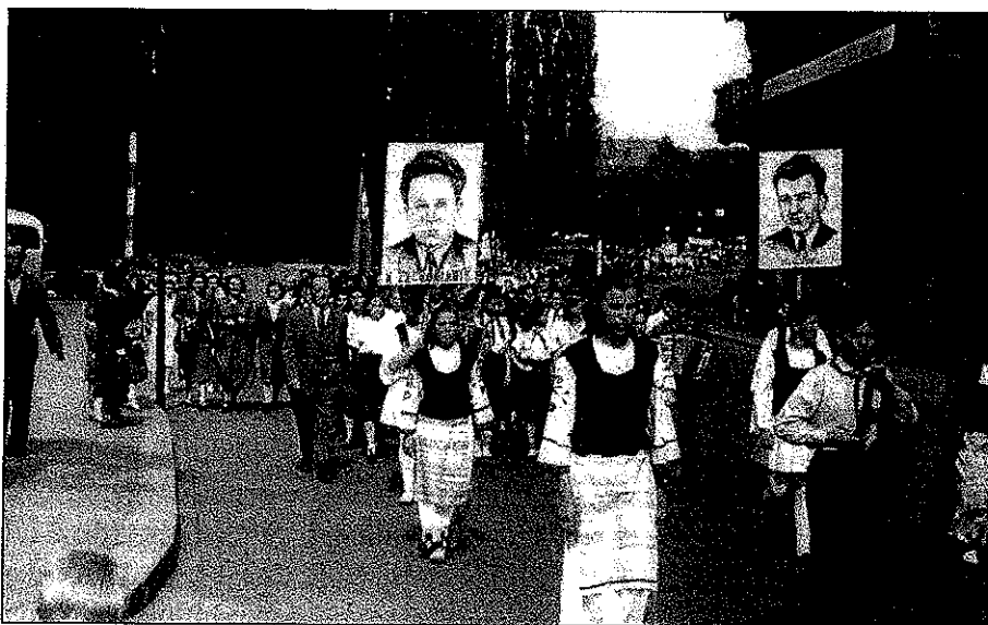
Řečtí studenti v prvomájovém průvodu s portréty N. Zachariadise a N. Belojannise. DD Karlovy Vary. 1954.