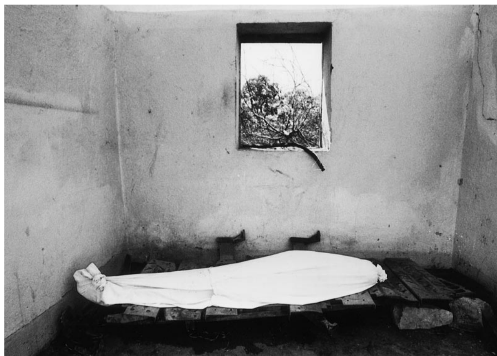
Přijde den, kdy násilí zmizí? (Oběť konfliktu mezi ozbrojenými milicemi a klany, jež zmítají Somálskem více než 15 let.)

A bylo by dobré přesně vědět, co to je. ■