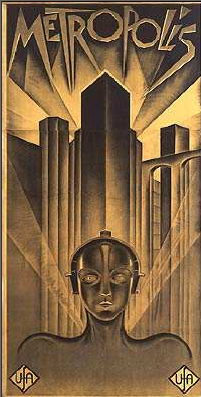
Metrópolis (1926) dir. Fritz Lang