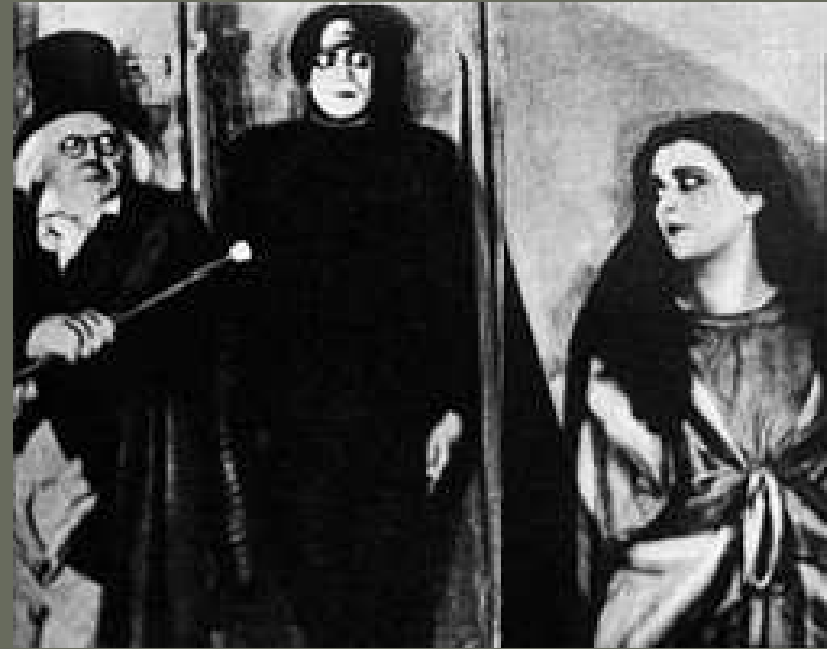
El gabinete del Doctor Caligari (1916) dir. Robert Wiene