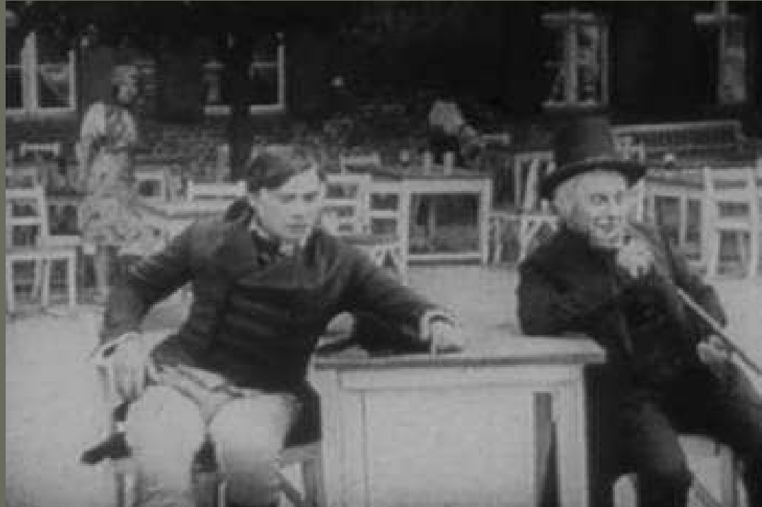
El estudiante de Praga (1913) dir. Stellan Rye