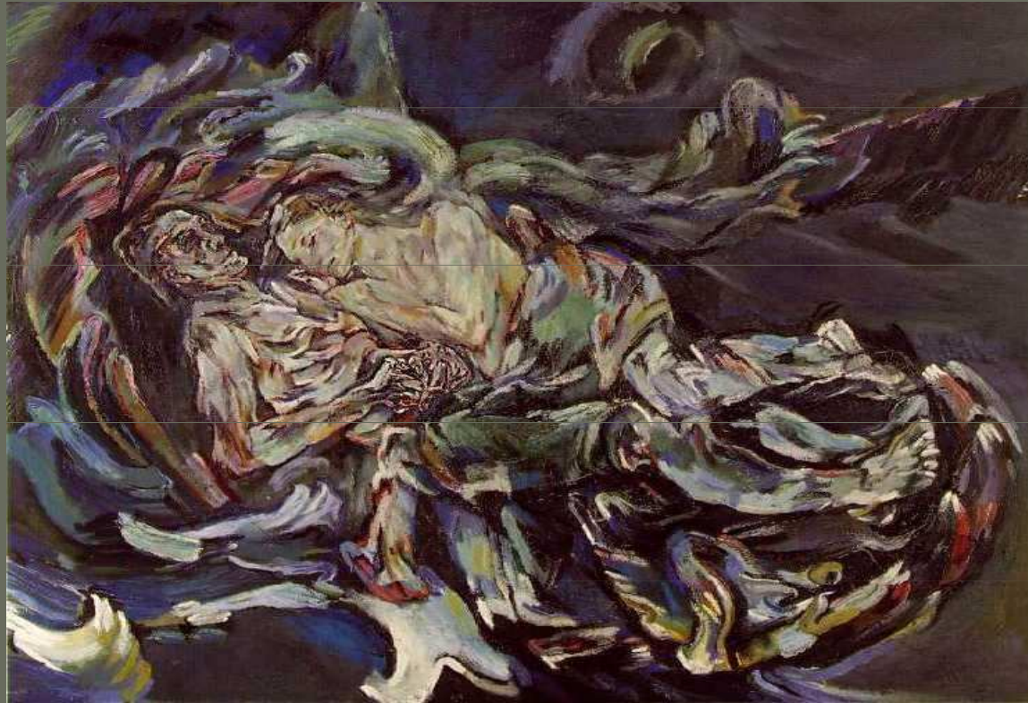
O.Kokoschka – Novia del viento

El máximo representante del expresionismo en Austria fue Oscar Kokoschka.