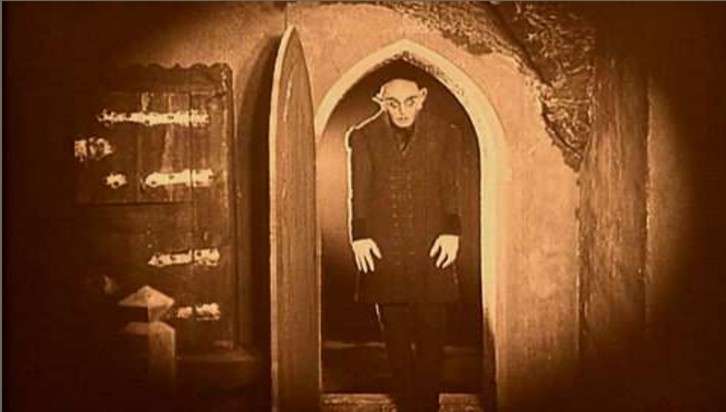
Nosferatu, una sinfonía del horror (1920) dir. F. W. Murnau