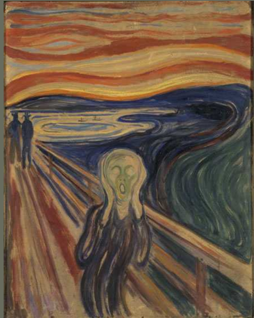
E.Munch - Grito