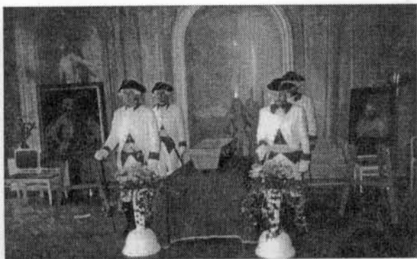
Uctění památky Marie Walburgy hraběnky z Truchsess-Waldburg-Zeilu (1762 Brno – 1828 Kunín) ve Freskovém sále na Staré radnici v Brně dne 17. května 2000.

děvčátku v Ratibořicích osm let, ale vzhledem k nejasnému datu narození možná i více. Snad právě mezi hrou na klavír, jízdou na koni či ručními pracemi listovala Barunka Panklová na chvalkovickém zámku knihami ze zámecké knihovny, vsávala duch svého kraje a přemýšlela, jak mu pomoci. V díle, které ušlechtilá česká žena Božena Němcová zanechala české kultuře, se objevují tyto snahy často a nejen v povídce V zámku a v podzámčí , která mi vytanula na mysl, když jsem přemýšlela o hraběnce Marii Walburze, ušlechtilé moravské ženě, žijící o generaci dříve, která – ač šlechtična – myslela i na nemajetné.