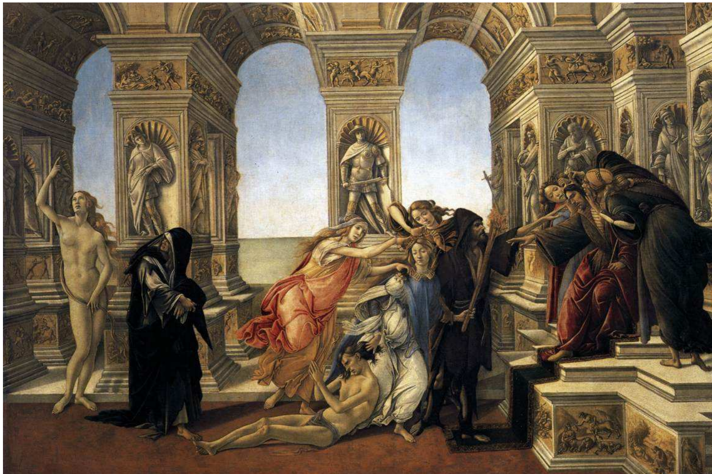
Sandro Botticelli, Pomluva Apellova, 1494-1495

Mimetické relace k antické literární produkci. Lúkiános, De calumnia , odtud popis námětu u L. B. Albertiho O malbě . Albertiho popis věrně reprodukoval S. Botticelli.