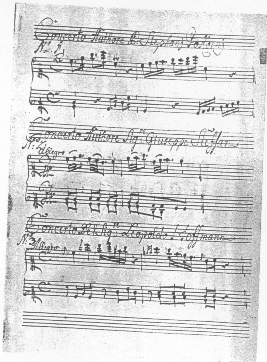
Obr. 6. Ukázka z inventáře hudebnin ze zámku Lešná u Gottwaldova, nedatováno. Asi z druhé poloviny 18. století. Hudebně-historické oddělení Moravského musea v Brně, sign.: G 85.