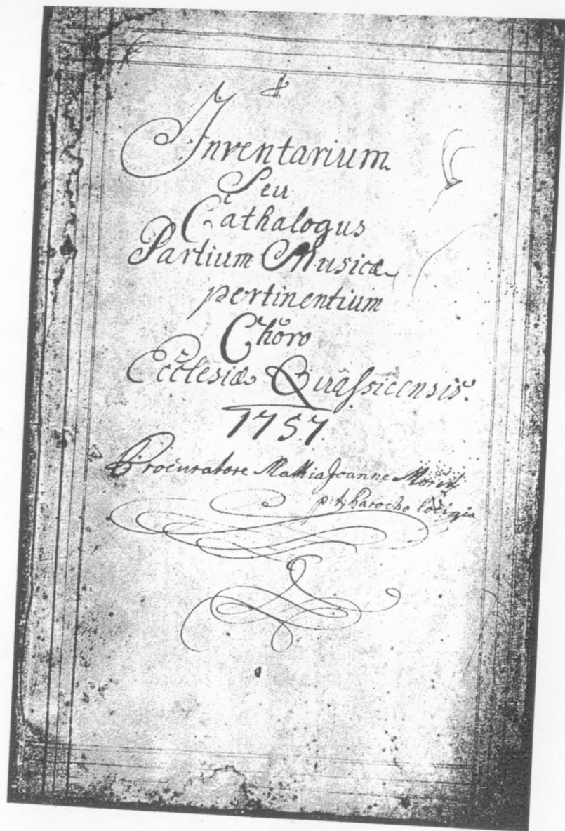
Obr. 8. Titulní list inventáře hudebnin z kúru farního kostela v Kvasicích z r. 1757. Hudební historické oddělení Moravského musea v Brně, sign. G 172.

ných dokumentů se záznamy v hudebních inventářích se podařilo identifikovat značný počet neznámých autorů a skladeb, jež mají někdy základní význam nejen pro určitou hudební lokalitu, ale i pro celkový dějinný vývoj hudebního myšlení. Srovnávací postup nám v takových případech také umožňuje soustavný průzkum stylových a vývojových problémů hudby jednotlivých hudebních lokalit a oblastí v kontextu s dějinným vývojem světové hudby.