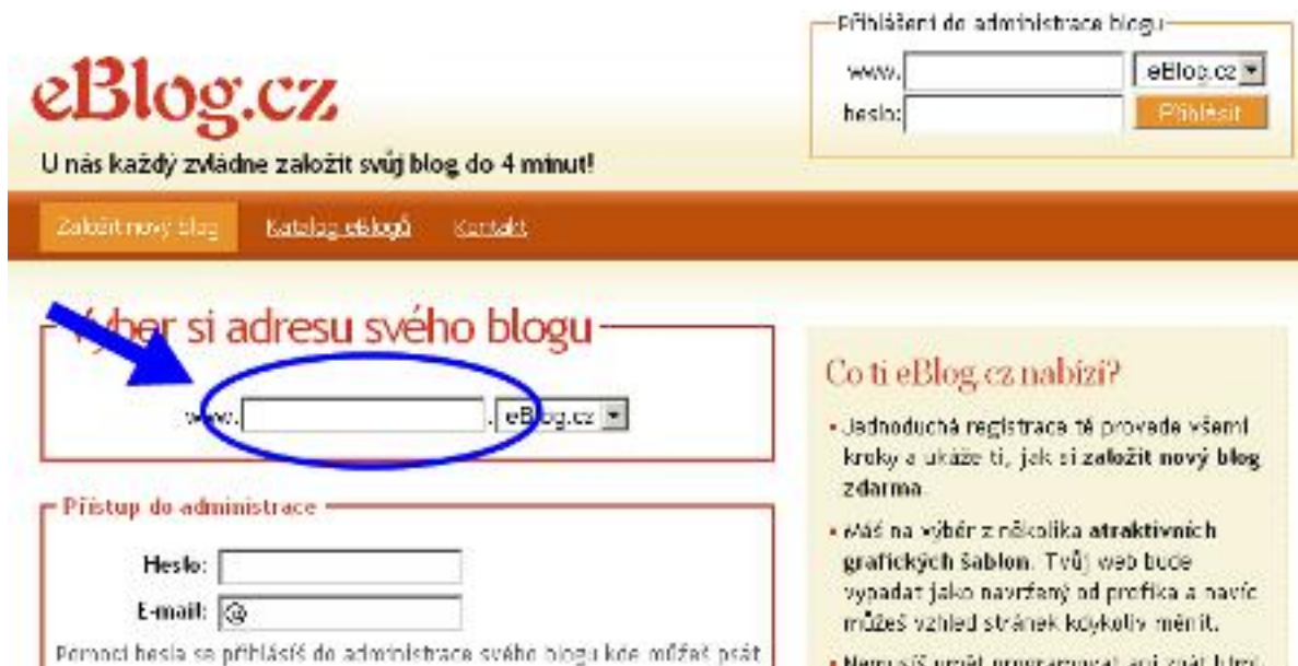
Obrázek 1.1: Hlavní stránka serveru eBlog.cz. Šipka ukazuje políčko, kam je třeba napsat svůj nick, pokud si zakládáte nový blog.

Příklad: Zvolím si jako svůj nick svoje příjmení: miessler . To znamená, že adresa mého blogu bude www.miessler.eblog.cz