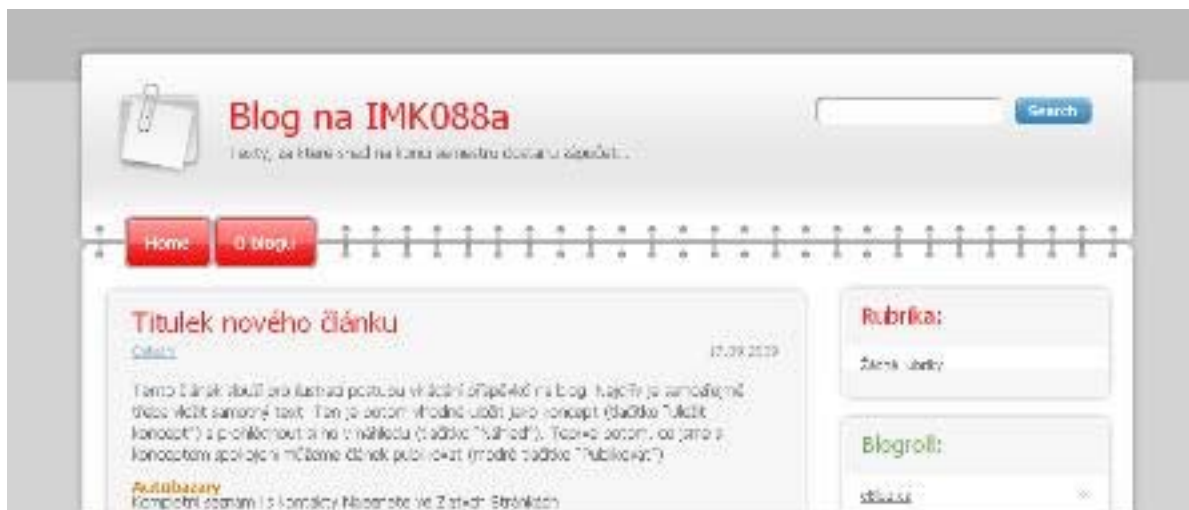
Obrázek 3.3: Náhled. Poté, co publikujete svůj první článek, můžete se podívat, jak to celé vlastně vypadá pro čtenáře vašeho blogu. Takto například vypadá můj pokusný blog na adrese http://miessler.eblog.cz/