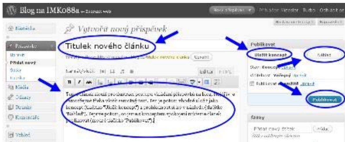
Obrázek 3.2: Vytvoření nového příspěvku. Nejdřív je třeba vložit titulek nového článku a samotný text. Ten je potom vhodné uložit jako koncept (tlačítko "Uložit koncept") a prohlédnout si ho v náhledu (tlačítko "Náhled"). Teprve potom, co jsme s konceptem spokojeni můžeme článek publikovat (modré tlačítko "Publikovat"). Od tohoto okamžiku visí váš článek na internetu.