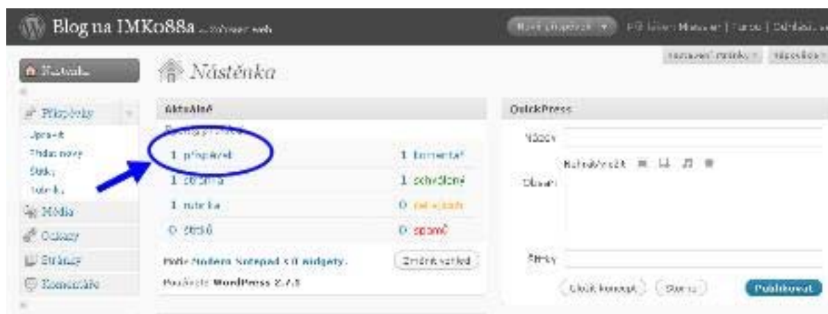
Obrázek 2.2: Administrace blogu. Po přihlášení se ocitnete v administrativní části svého blogu. Právě zde je možné vkládat a mazat články a upravovat nastavení blogu. Nyní klikněte na položku "1 příspěvek".