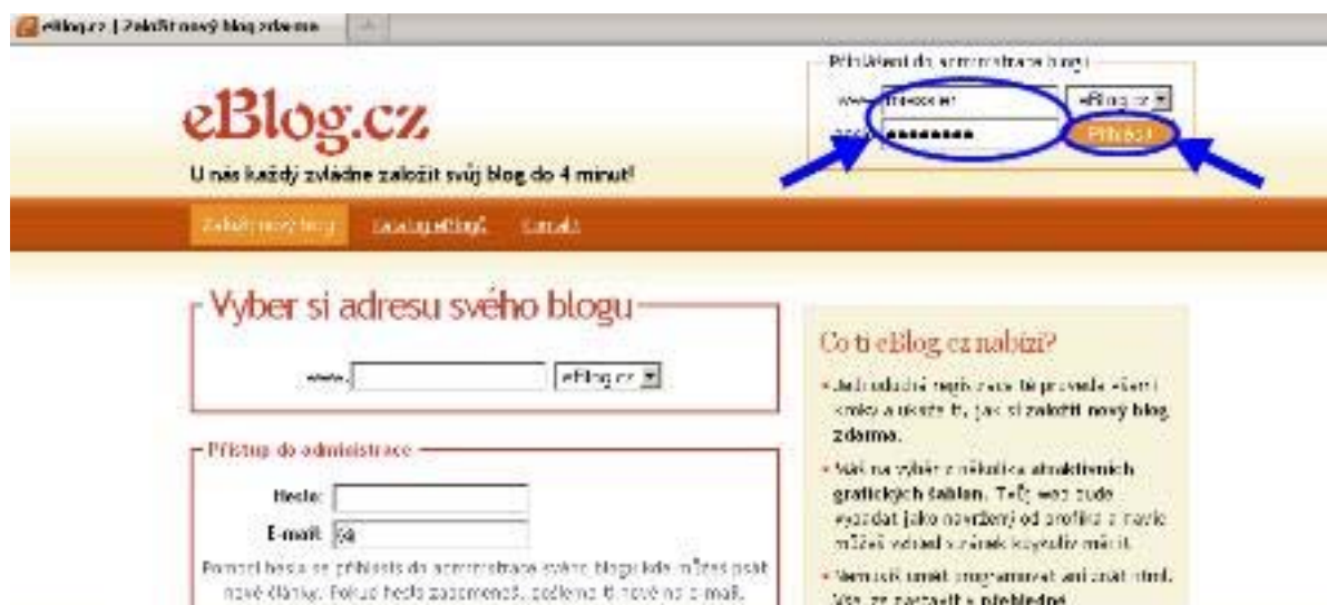
Obrázek 2.1: Přihlášení. V pravém horním rohu se přihlašte do svého profilu tím, že do označených políček vyplníte svůj nick a svoje heslo.

Po založení blogu vám server automaticky vygeneruje první článek s názvem "Ahoj blogere!", který je třeba smazat. Začneme opět na hlavní stránce serveru eBlog.cz .