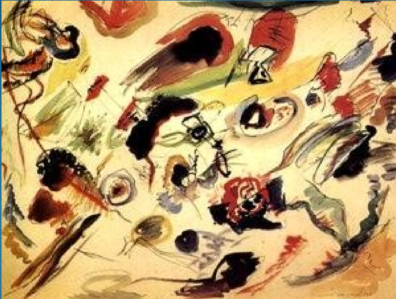
Vassilij Kandinskij, Primo acquerello astratto, 1910