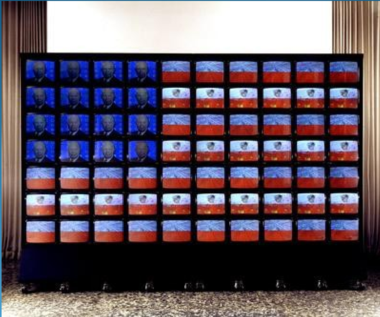
Paik: Video Flag (1985)