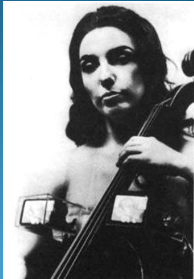
TV Bra for Living Sculpture (1968-69)