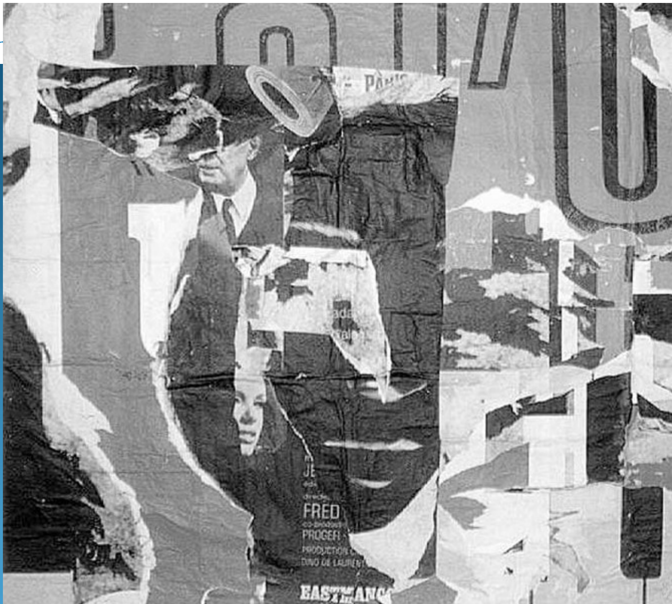
Jacques Villeglé, „ affiches lacérées ”