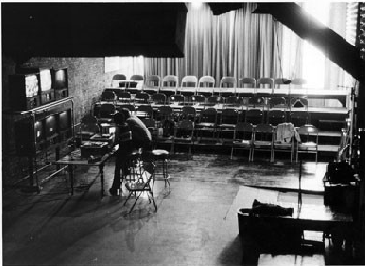
THE KITCHEN IN 1971 240 HENDEL ST. N.Y.C.