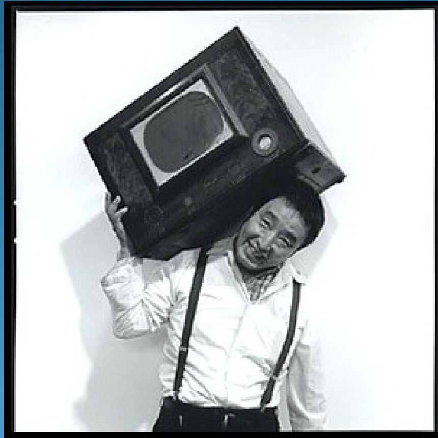
Nam June Paik (1932 – 2006)