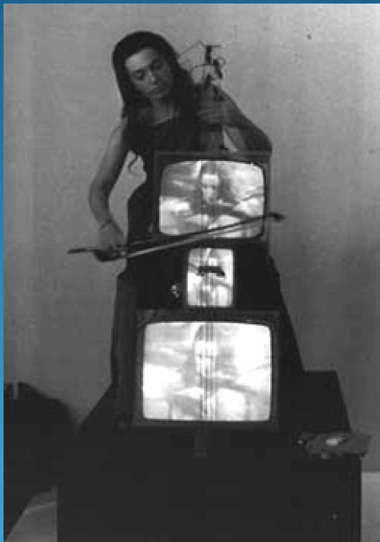
Concerto for TV Cello and Video tape - 1971