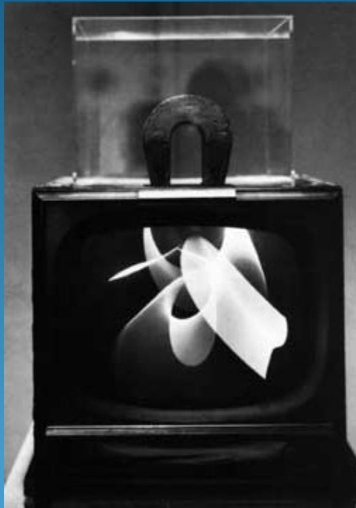
Nam June Paik - Magnet TV - 1965