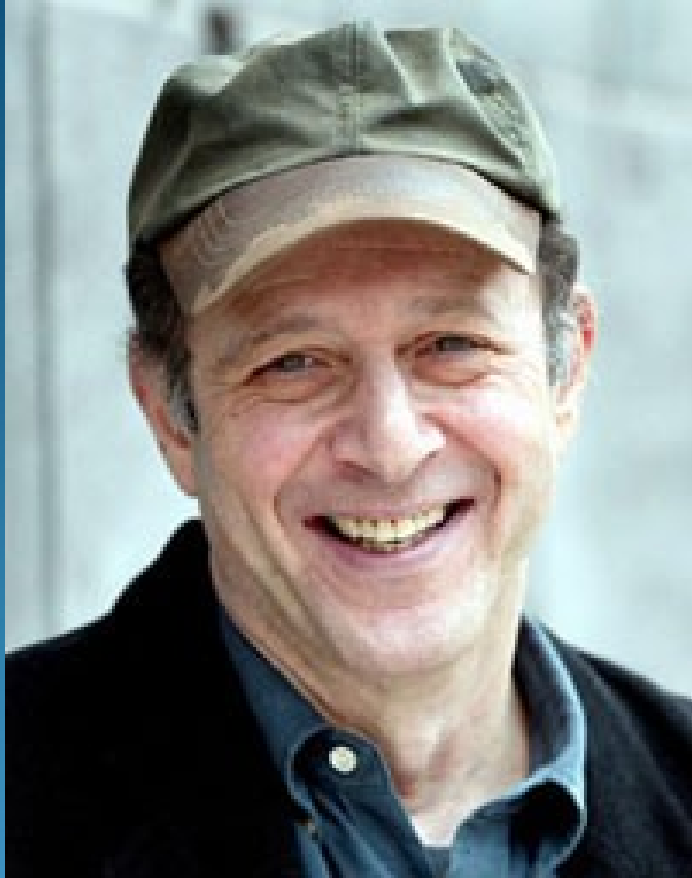
Steve Reich (*1936)