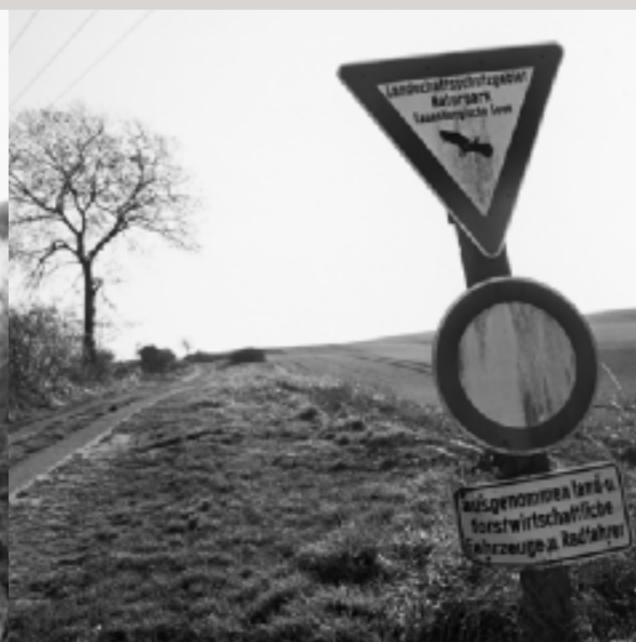
Ein Stück Kolonnenweg bei Wietingsbek in Richtung Lankower See. Dieser Verbindungsweg im Osten entlang der ehemaligen Grenze wird heute oft als Rad- und Wanderweg genutzt.