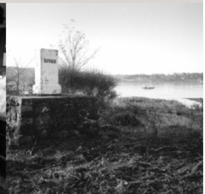
Bei diesem Grenzstein in Lazaretto, zwischen Muggia und Koper gelegen, befand sich eine Grenzübergangsstelle und der ehemalige Eisernen Vorhang endete im Meer.