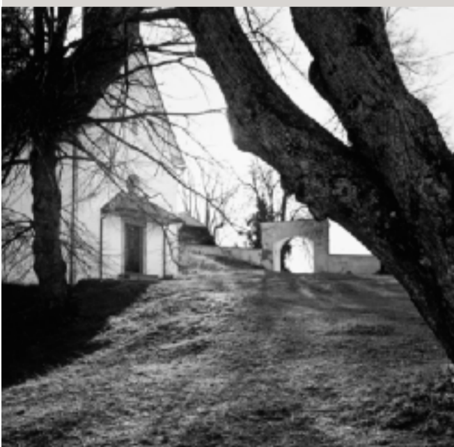
Die Pfarre zur Kirche Heiliger Geist am Osterberg bei Leutschach war durch den Eisernen Vorhang geteilt.