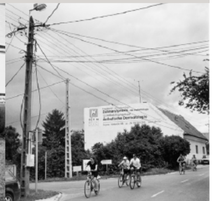
Im Ortgebiet von Fertőrákos.