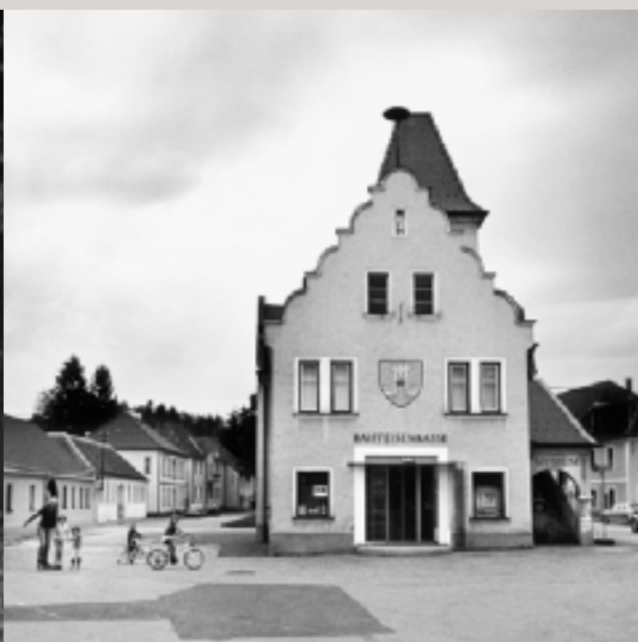
Hauptplatz von Weikertschlag an der Thaya.