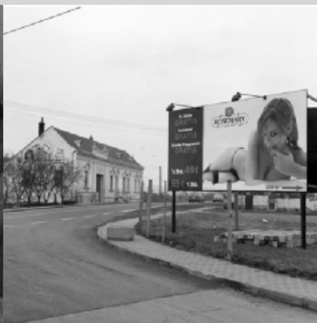
Unterwegs von Kleinhaugsdorf nach Dyjákovice.