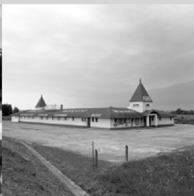
Ein verlassenes Einkaufszentrum am Grenzübergang von Heiligenkreuz nach Szentgotthárd.