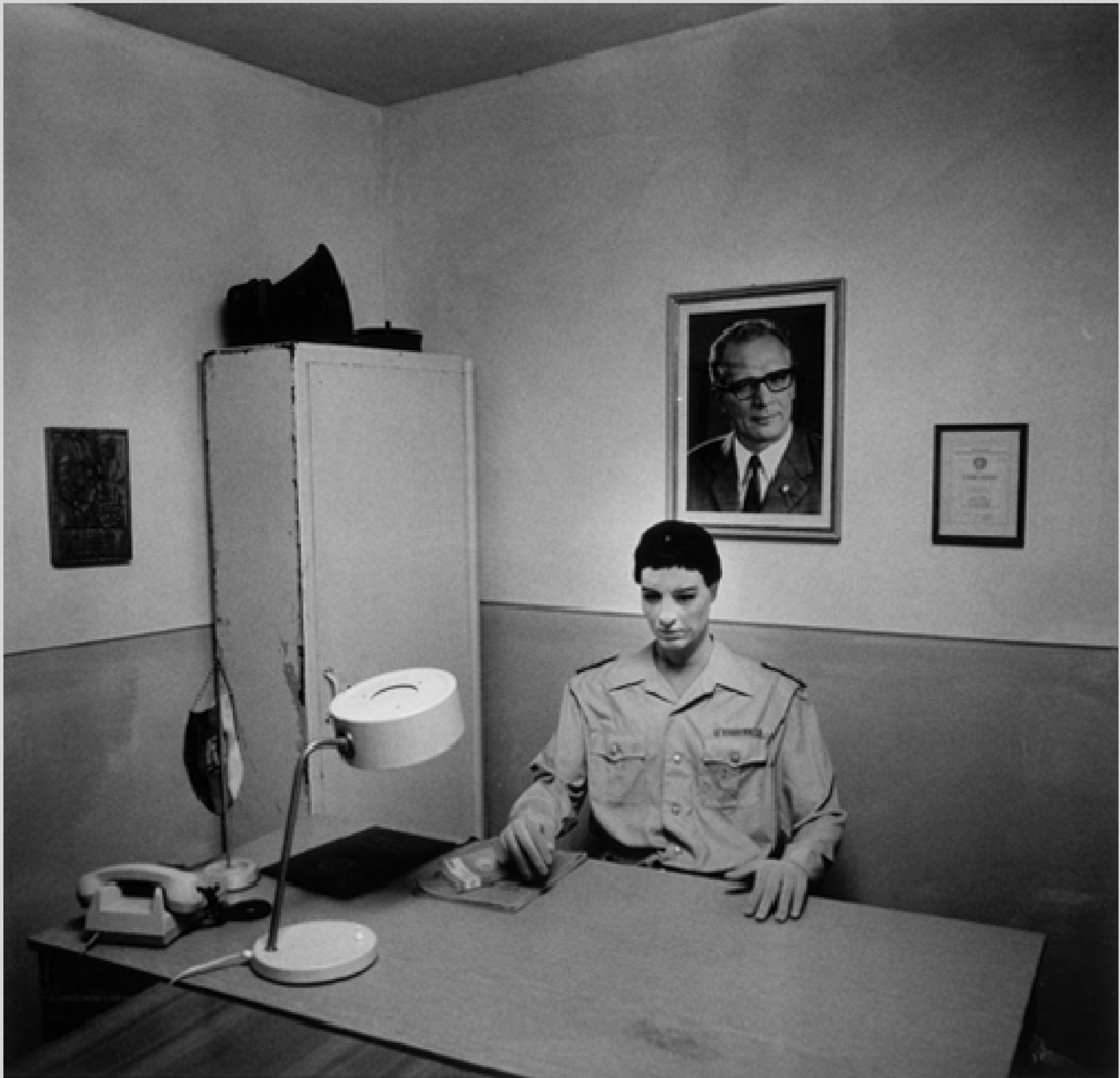
Nachbildung eines DDR-Grenzkontrollzimmers im Museum Point Alpha bei Geisa, ein ehemaliger US-Beobachtungsstützpunkt an der innerdeutschen Grenze.