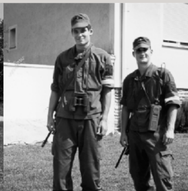
Zwei österreichische Präsenzdiener auf Patrouillengang im burgenländischen Grenzort Bildein.