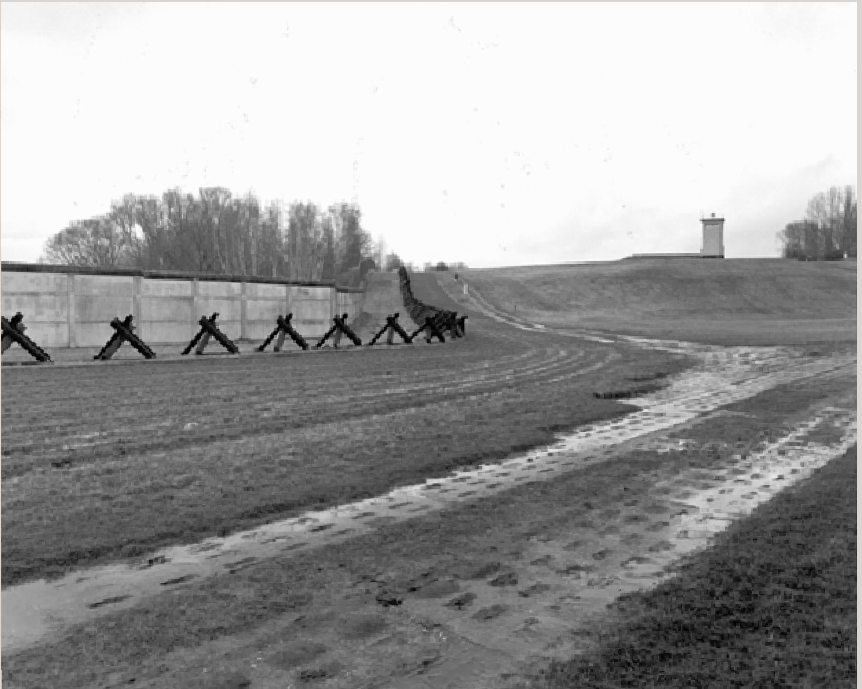
Das Grenzdenkmal Hötensleben mit einem Stück noch erhaltener Mauer und verschiedenen Grenzsicherungsanlagen befindet sich unmittelbar am Ortseingang.