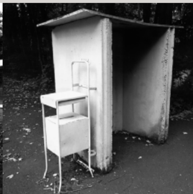
Reste von Grenzsicherungsanlagen in einem kleinen Waldstück zwischen Eußenhausen und Henneberg.