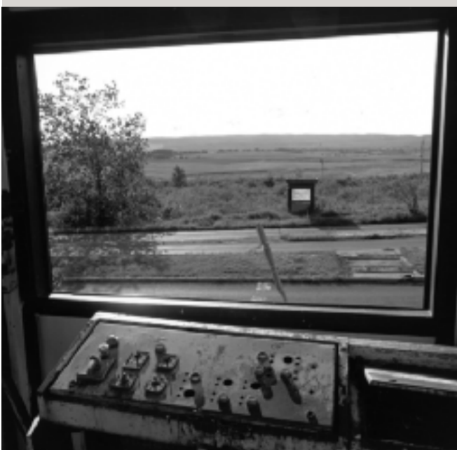
Blick aus einem ehemaligen Wachturm auf den österreichisch-ungarischen Grenzübergang Klingbach.