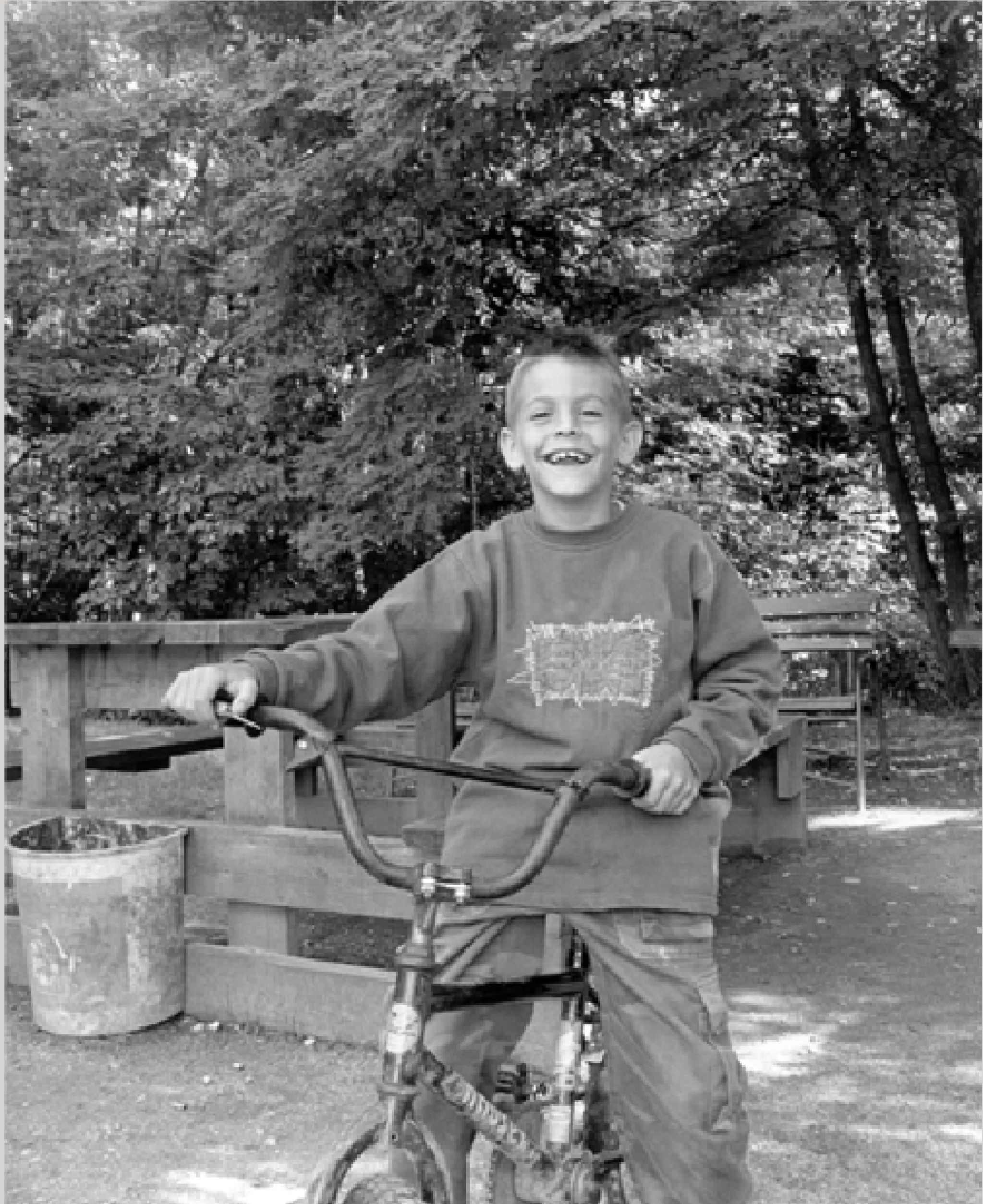
Am Hauptplatz in Brennbergbánya. Der ungarische Bergbauort ist an drei Seiten durch den ehemaligen Eisernen Vorhang eingeschlossen.