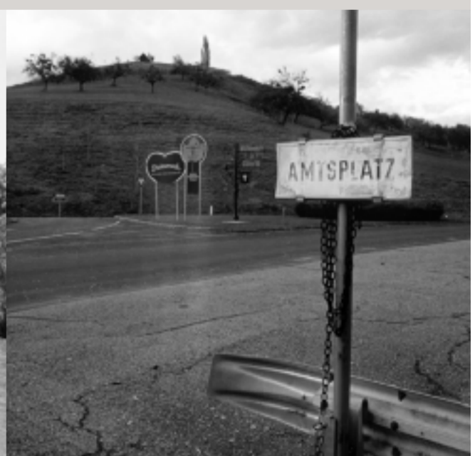
Grenzübergang an der alten Weinstraße bei Langegg.