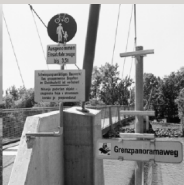
Die Steierbrücke / Štajerski most bei Apače in Slowenien wurde 2005 für Fußgänger und Radfahrer, aber ganz offensichtlich nicht für Militärkolonnen errichtet.