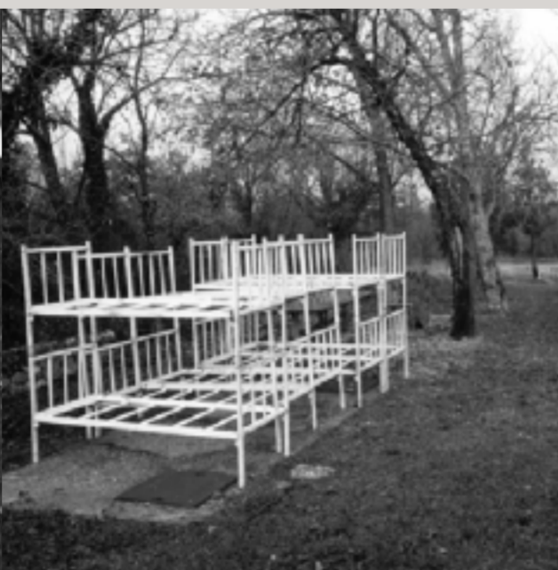
Reste einer verlassenen Grenzstation in Nova Vas.