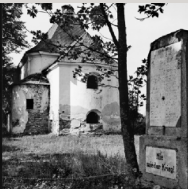
Die zerstörte Kirche von Buchers / Pohorl na Šumavě mit einem Kriegerdenkmal aus dem ersten Weltkrieg, wenige Kilometer hinter der ehemaligen Grenze, über die heute ein Wanderweg führt.