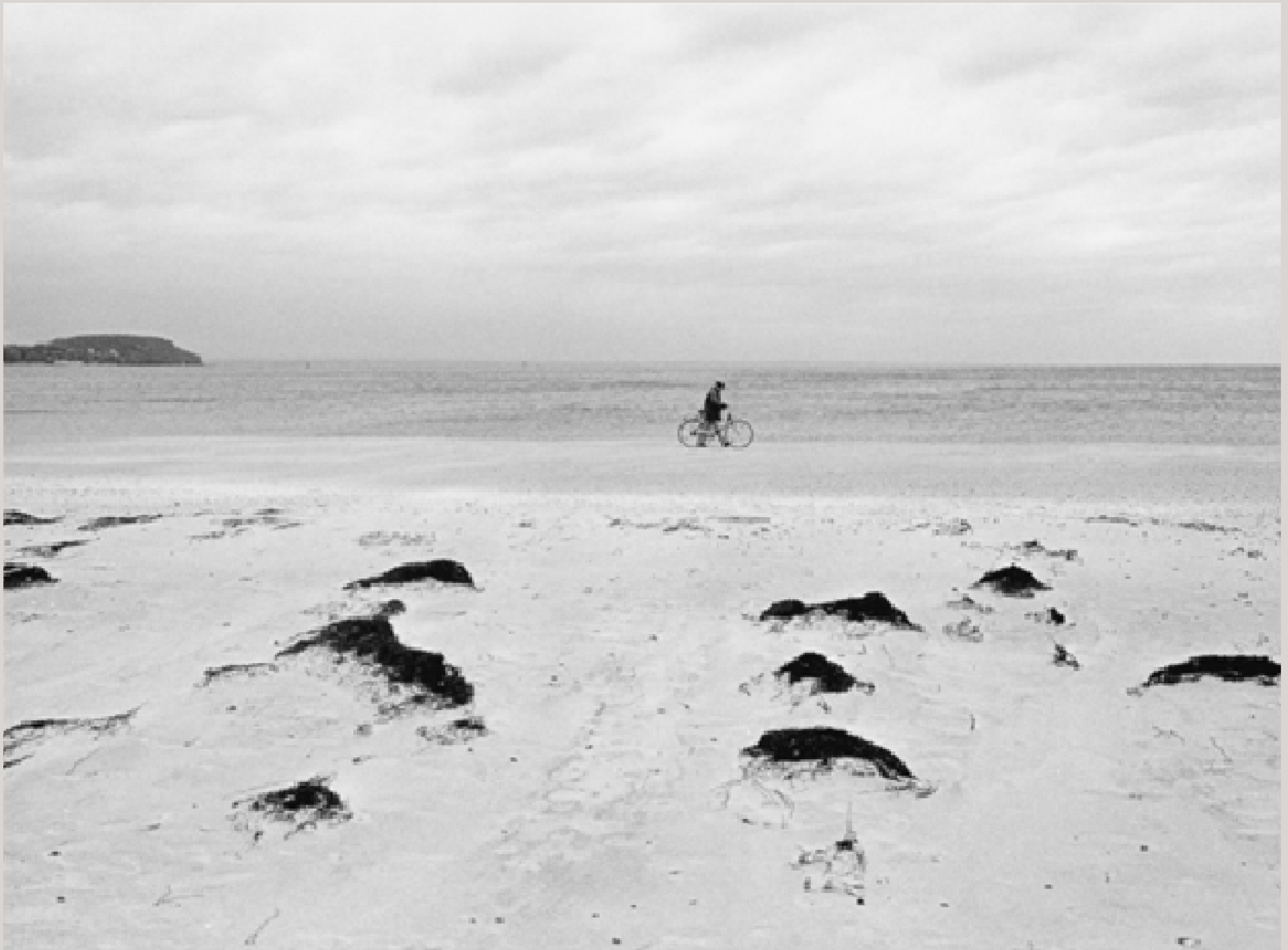
Der Radfahrer geht am Strand der Halbinsel Priwall an genau jener Stelle, an der früher der Eisener Vorhang in die Ostsee hineinreichte. Die Halbinsel Priwall war auf der Landseite durch den Eisernen Vorhang getrennt und besaß auf der Seeseite eine Fährverbindung zu Travemünde / Lübeck.