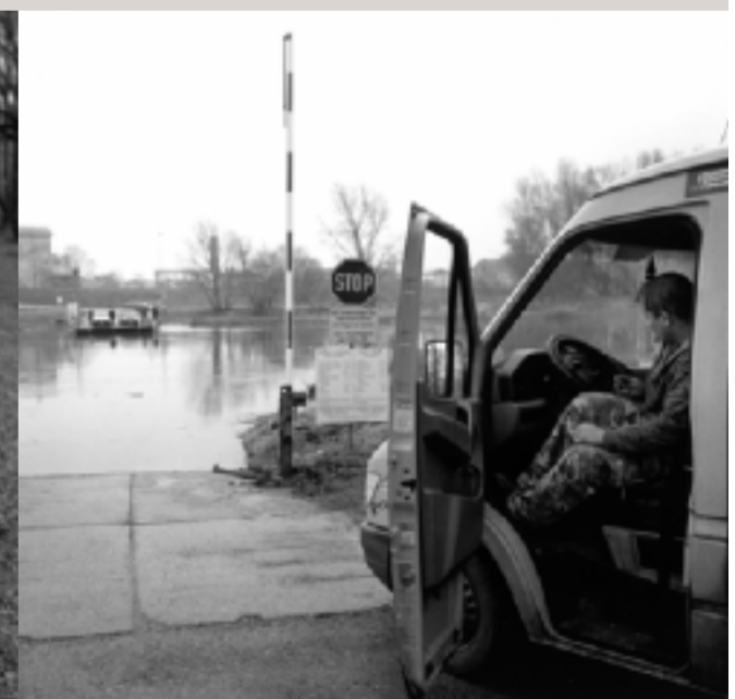
Fähre beim Grenzübergang von Angern an der March nach Záhorská Ves.