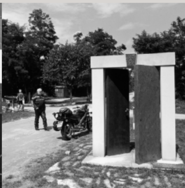
Steinskulptur in der Form einer geöffneten Tür am Ort des Paneuropäischen Picknicks, errichtet durch die Steinmetzmeister von Fertőrákos.