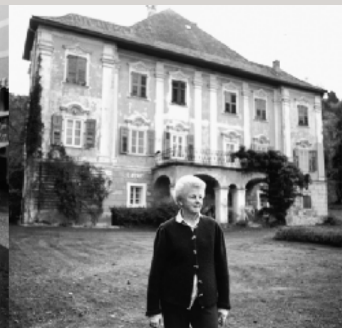
Schloss Ebenwein in Leifling, seit 1963 im Besitz der Familie Glawischnig, lag unmittelbar an der Grenze.