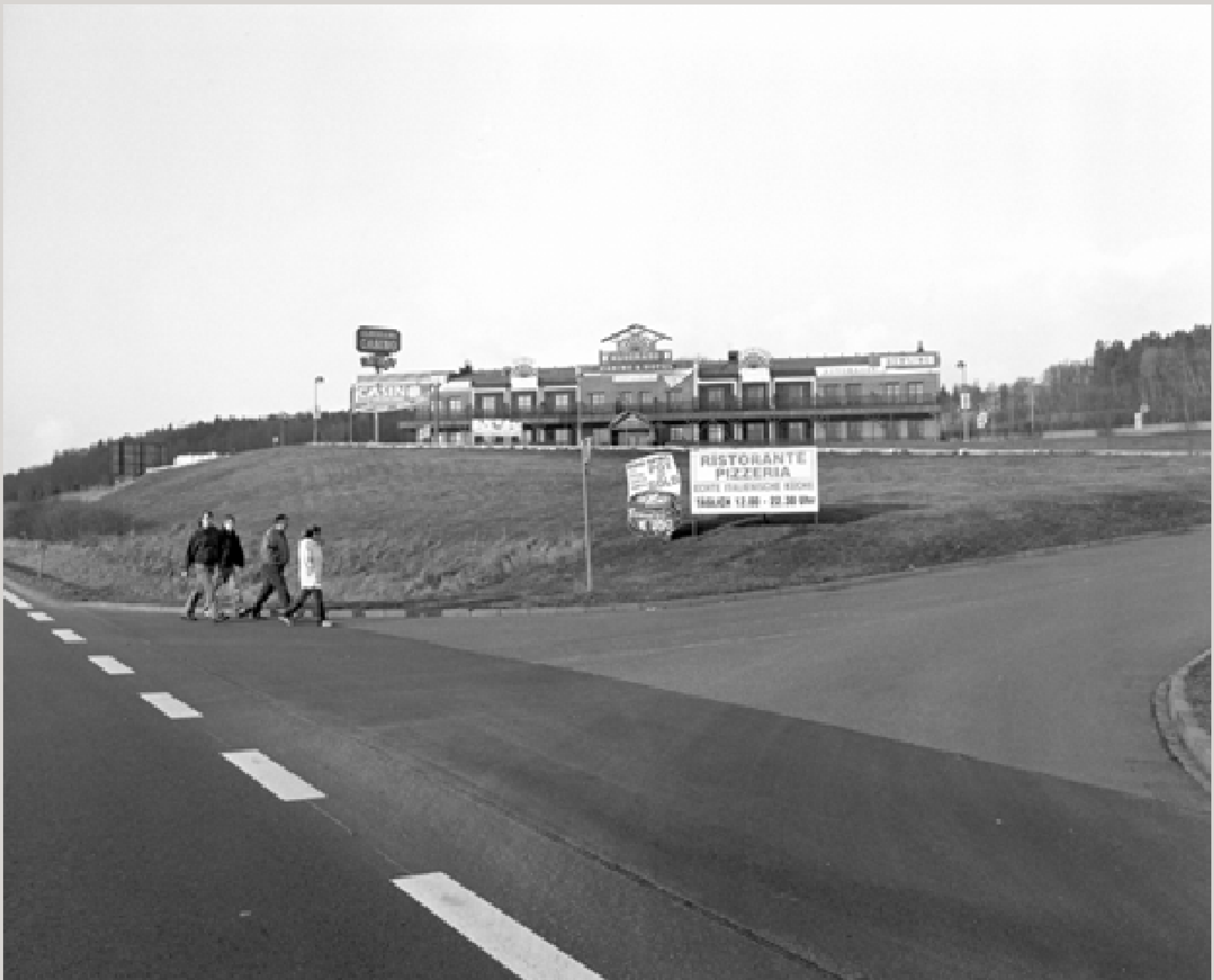
Ein Casino auf tschechischer Seite beim Grenzübergang Furth im Wald / Schafberg.