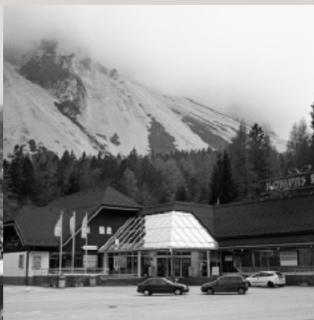
Österreichisch-slowenische Grenze am Loiblpass.