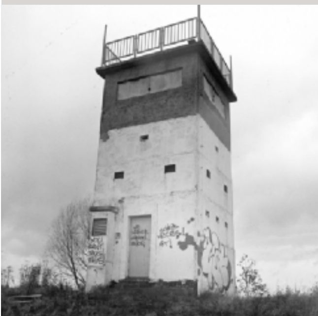
Der Kontrollturm K3 zur Grenzsicherung am Dassower See, wenige Kilometer von der Ostsee entfernt.