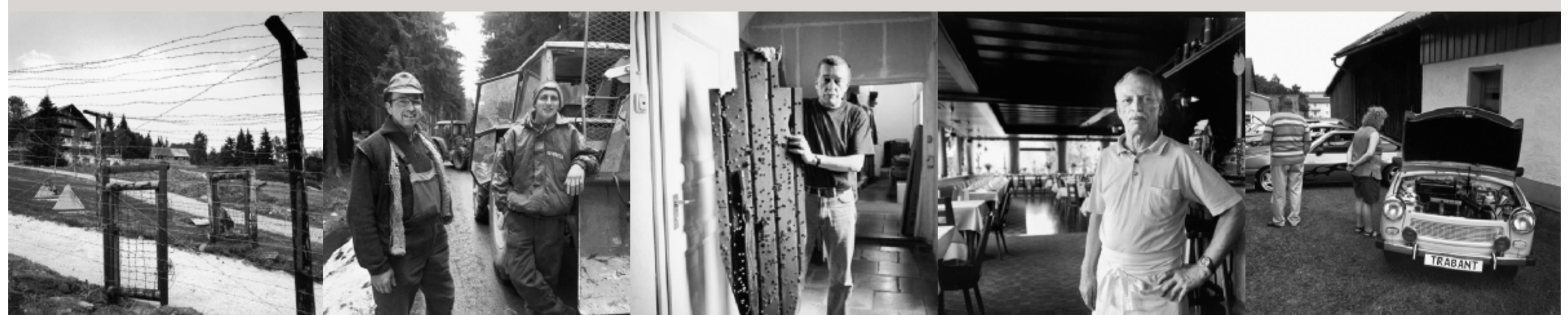
Reste der Speranlagen des ehemaligen Eisernen Vorhangs als Teil einer geplanten Hotel- und Freizeitanlage in Finsterau.