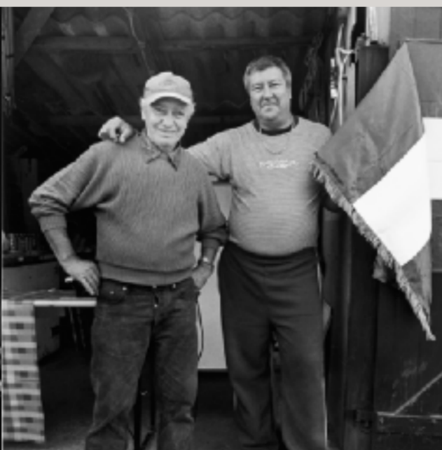
Vorbereitungen für ein Fußballspiel im Grenzort Brennbergbánya.