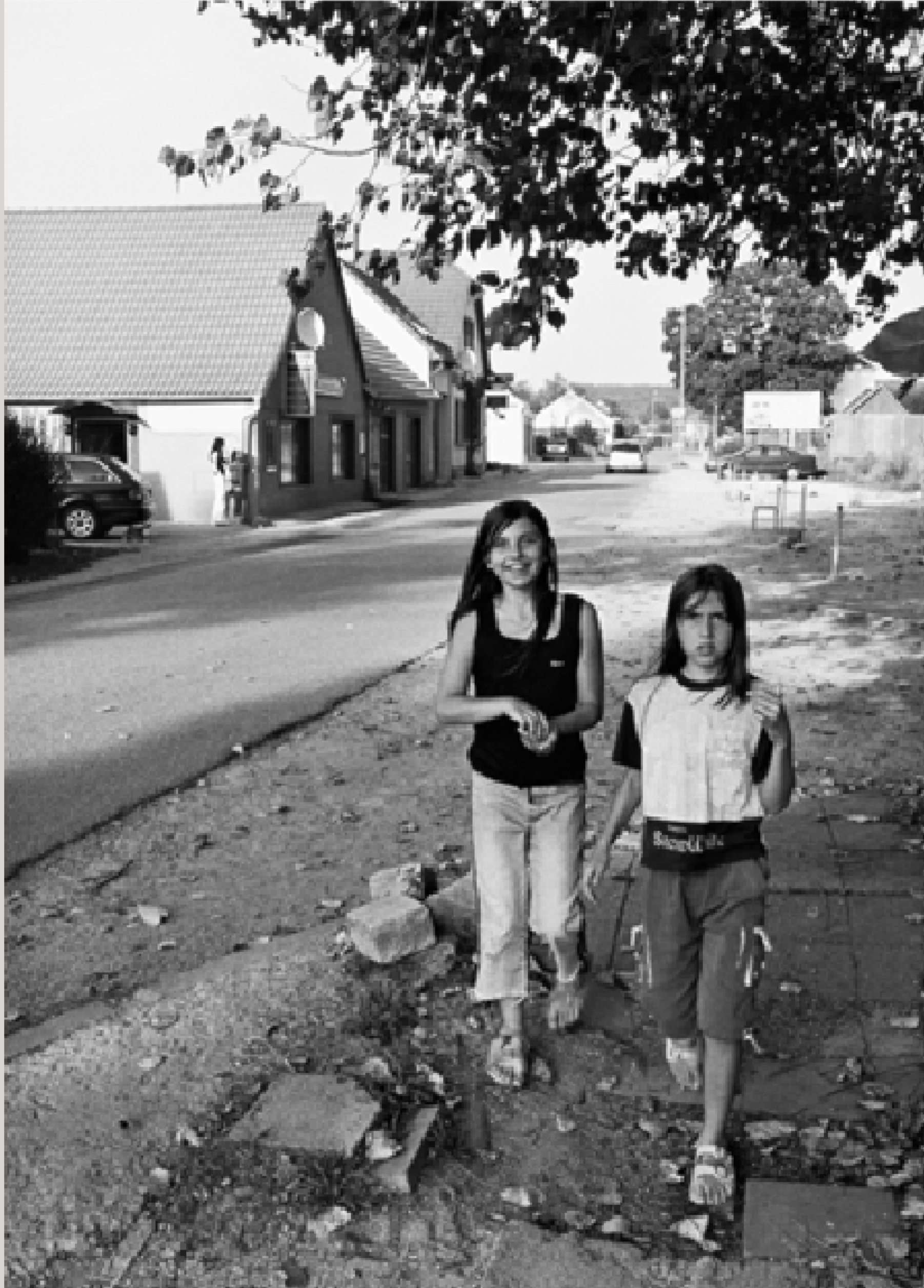
Im ehemaligen Niemandsland zwischen Gmünd und Česká Velenice.