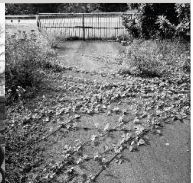
Überwucherter Zufahrtsweg zur ehemaligen Grenzkontrollstelle zwischen Eußenhausen und Henneberg.