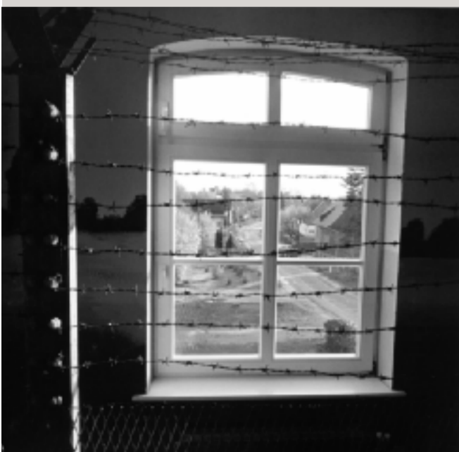
Blick aus dem Grenzlandmuseum Grenzhaus in Schlagsdorf auf die Zufahrtsstraße zu den ehemaligen Grenzsicherungsanlagen.