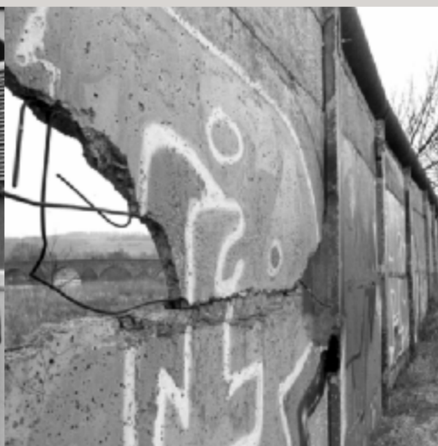
Mit Graffiti bemalte Reste der Grenzmauer in Vacha eröffnen den Durchblick auf die historische Werrabrücke, die seit der Wende als Brücke der Einheit bezeichnet wird.