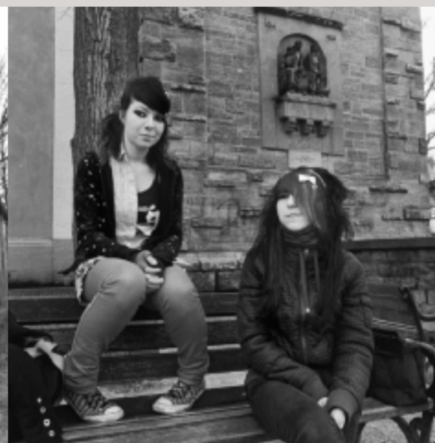
Jugendliche vor der St. Annen Kirche in Eisenach.