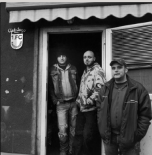
Fußballfans aus Hötensleben vor ihrem Vereinsheim.