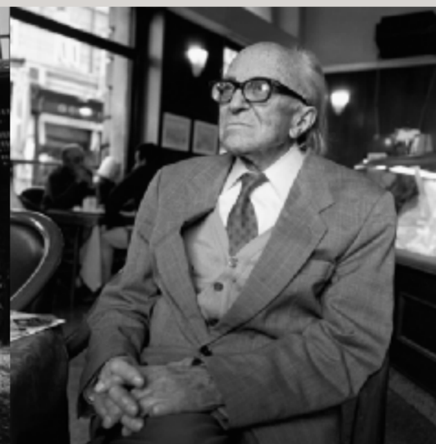
Der Schriftsteller Boris Pahor im Café Stella Polare in Triest. Er hat sich in seinem Werk auch für die slowenische Minderheit in Italien eingesetzt.