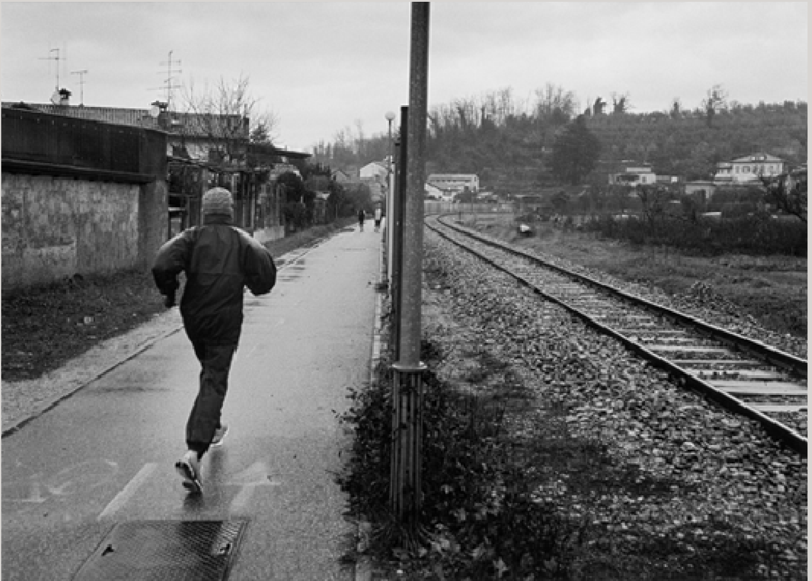
Jogger entlang der Grenze zwischen Nova Gorica (Slowenien) im rechten Teil des Bildes und Gorizia (Italien).