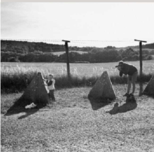
Reste des Eisernen Vorhangs bei Čížov, die hier als Mahnmahl erhalten blieben.