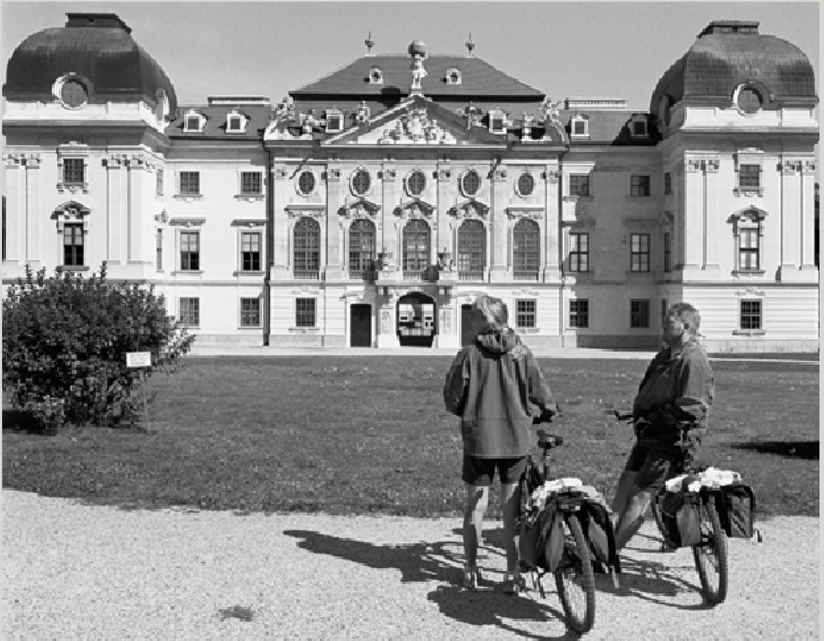
Zwei Radfahrer aus Tschechien besuchen das direkt an der Grenze liegende Schloss Riegersburg.