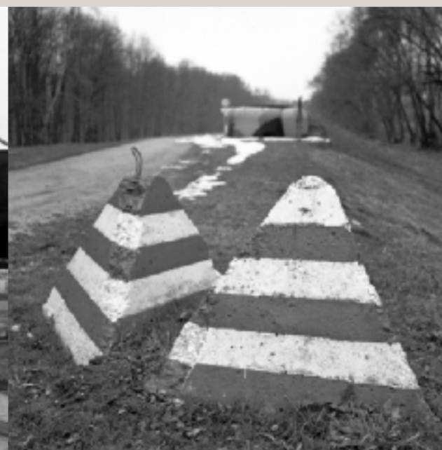
Bemalte Panzerperren als Straßenbegrenzungen und ein Bunker im Hintergrund, am Grenzübergang von Hohenau an der March nach Moravský Svätý Jan.