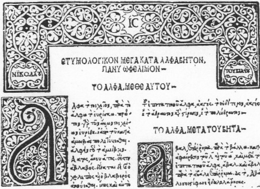
Fig. 23. Etymologicum Magnum, Venice, Zacharias Kalliergis and Nicolaos Vlastos, 1499.