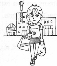
at a department store