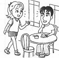
at a coffee shop