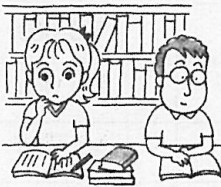
in the library