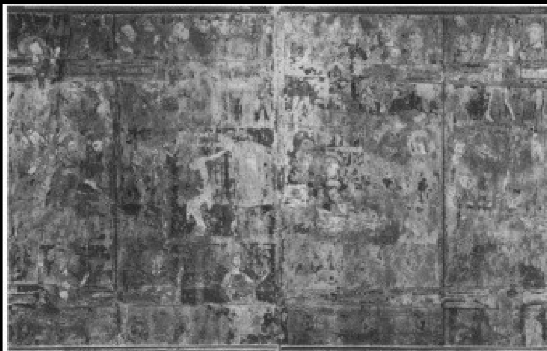
4 Altenberg Altarpiece. Wings: Frankfurt, Städel Kunstinstitut; center section: Schloss Braunfels a. Wings closed