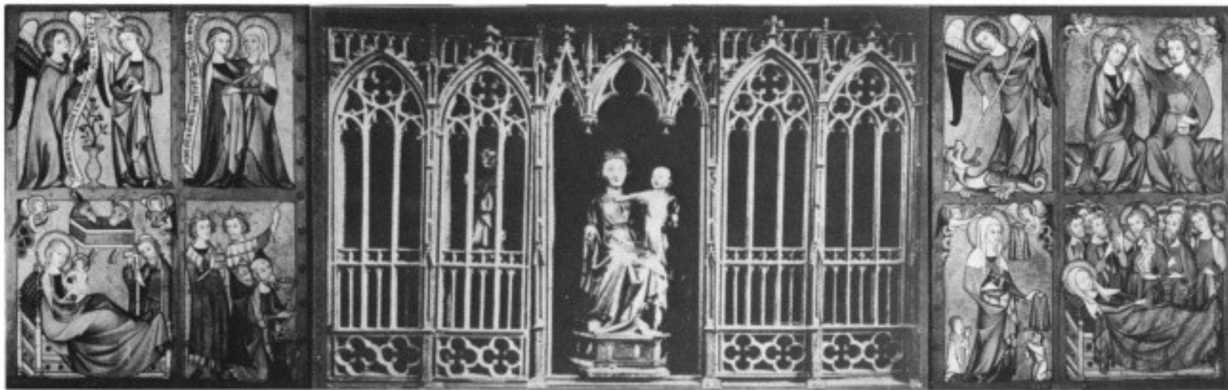
c. Wings fully opened