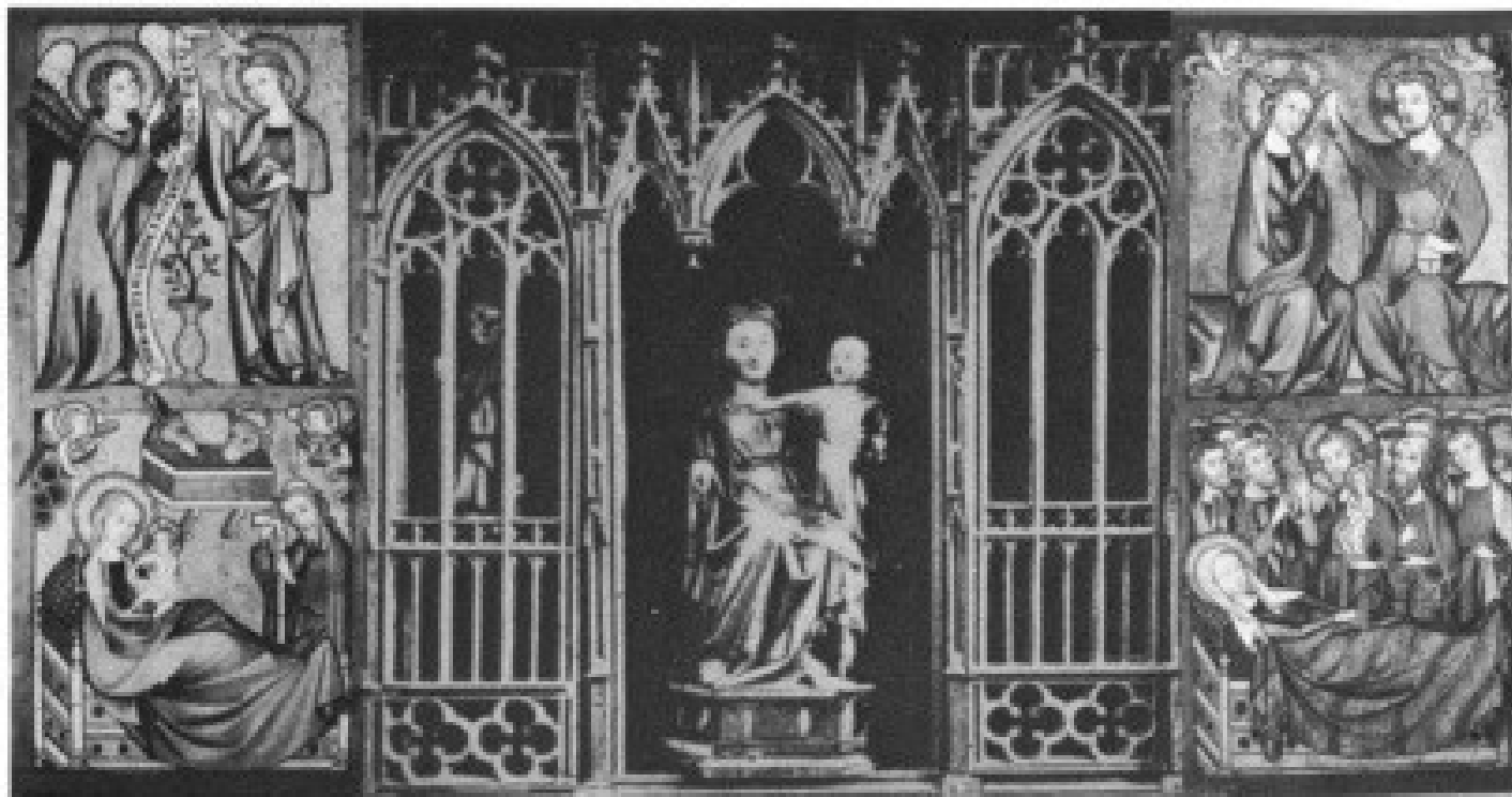
b. Center panels opened (photo: wings, Städel Kunstinstitut, center section from Braun, pl. 335)