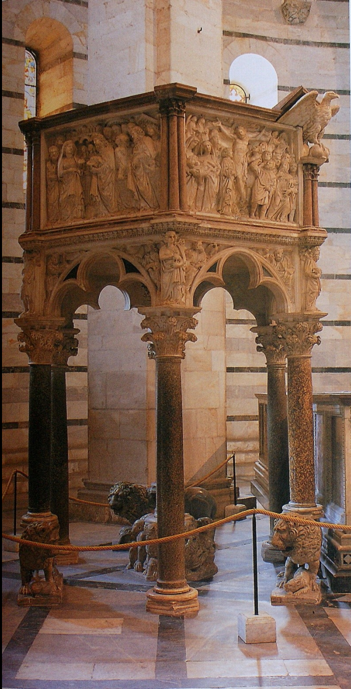
Nicolo Pisano Kazatelna v Pise, dok. r. 1258