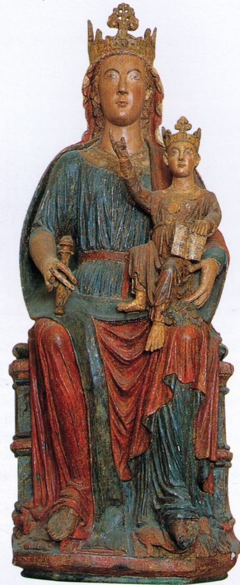
204. Virgin and Child; Chiesa del Crocifisso, Brindisi; polychromed wood, c.1240-50