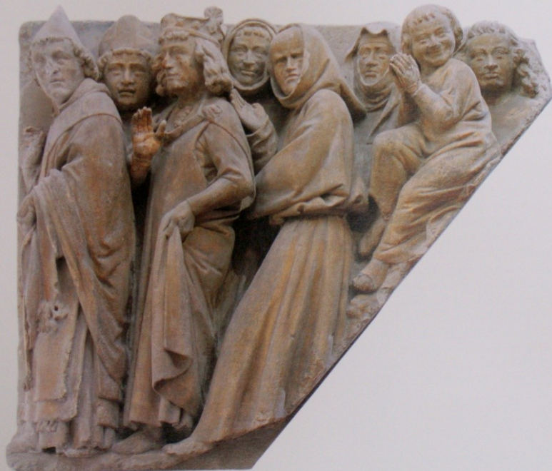
264. The Blessed; relief from the Westwerk, Mainz Cathedral; c.1237-9 (Bischöfliches Diözesan- und Dommuseum, Mainz)